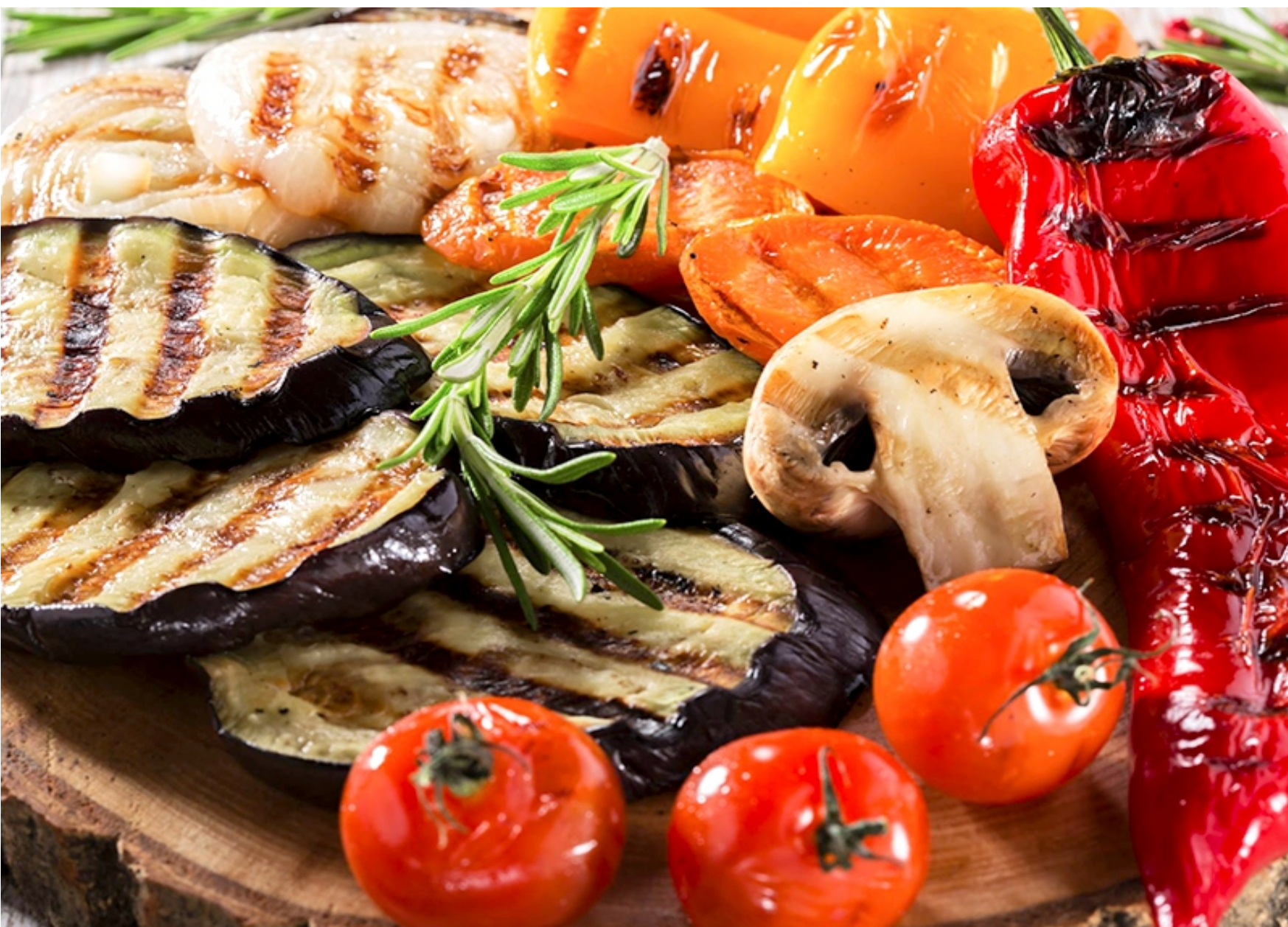
ОВОЦИ ГРИЛЬ - 200/30 - 380руб