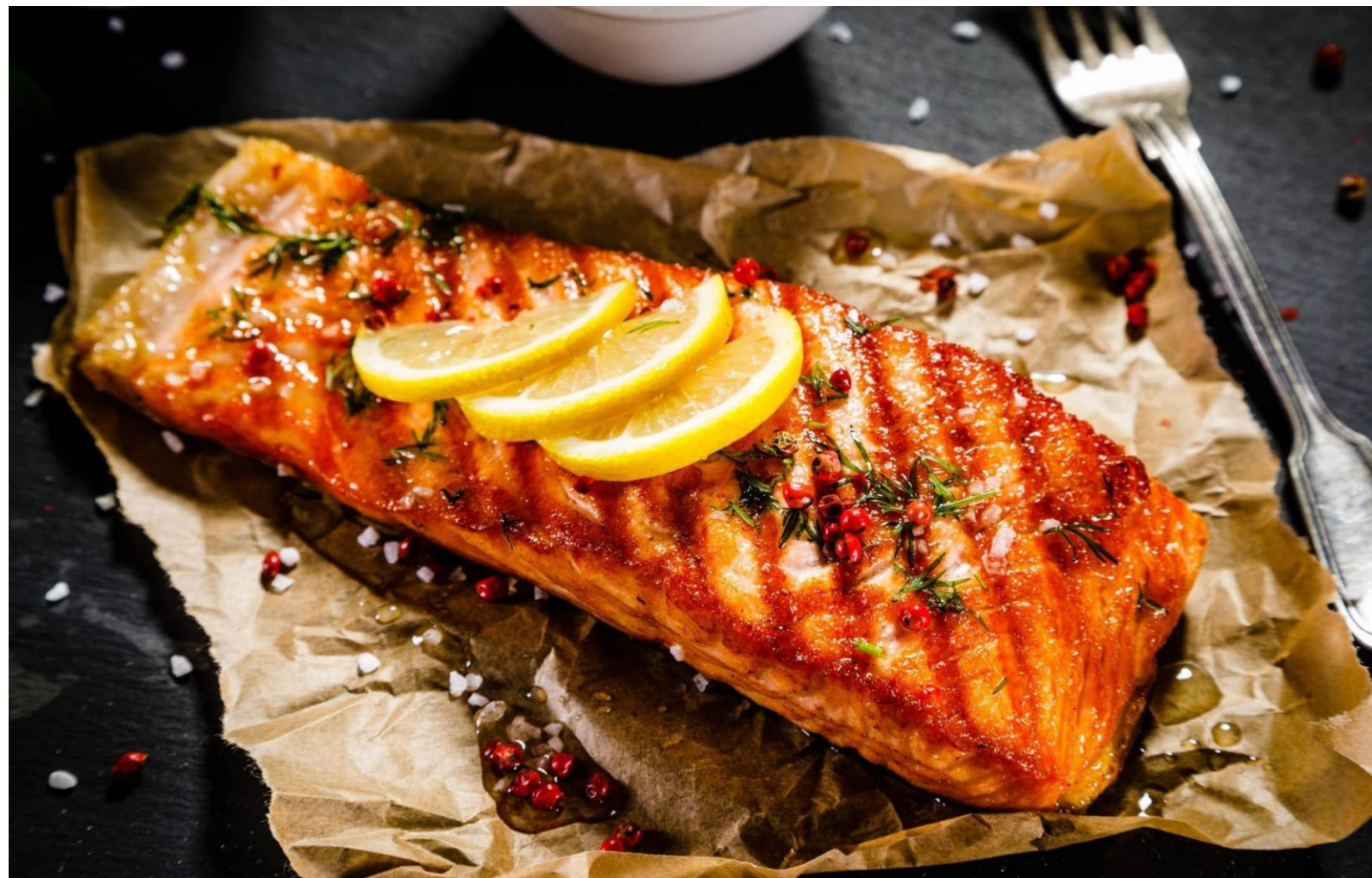
ЛОСОСЬ ГРИЛЬ - 160/30/30 - 950руб