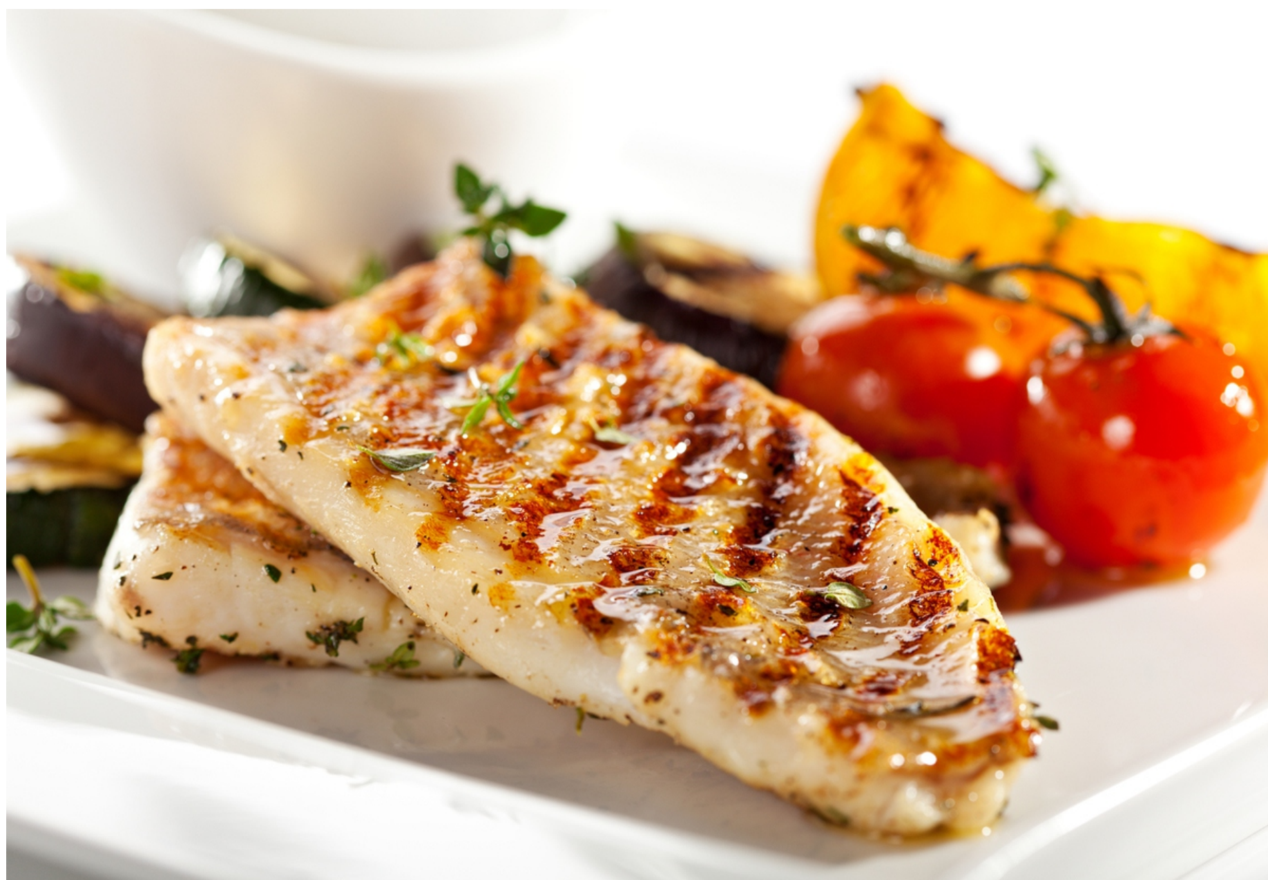
ФИЛЕ СУДАКА ЖАРЕНОЕ ПО РЫБАЦКИ - 150/50/30 - 690руб