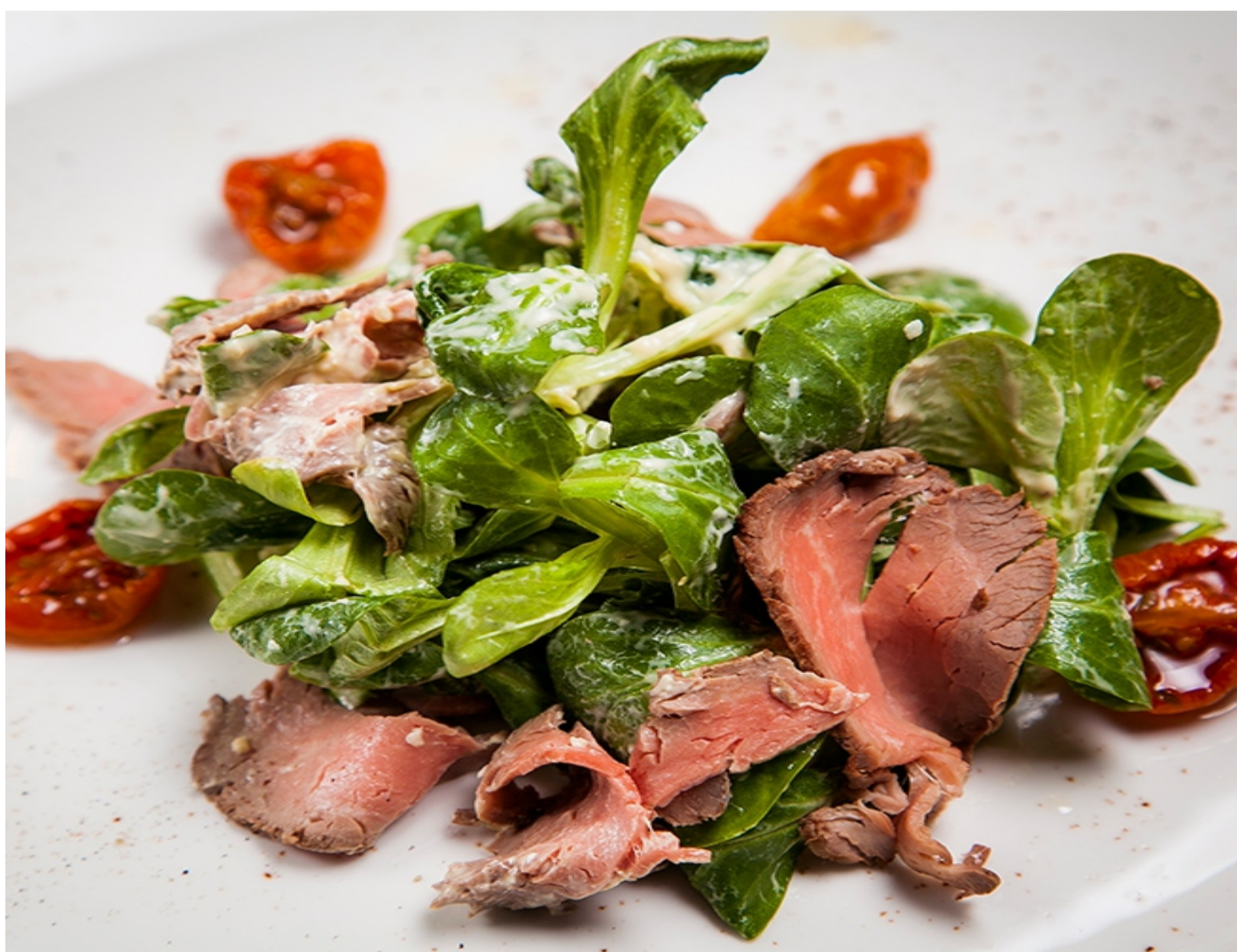
САЛАТ РОСТБИФ - 350гр - 750руб