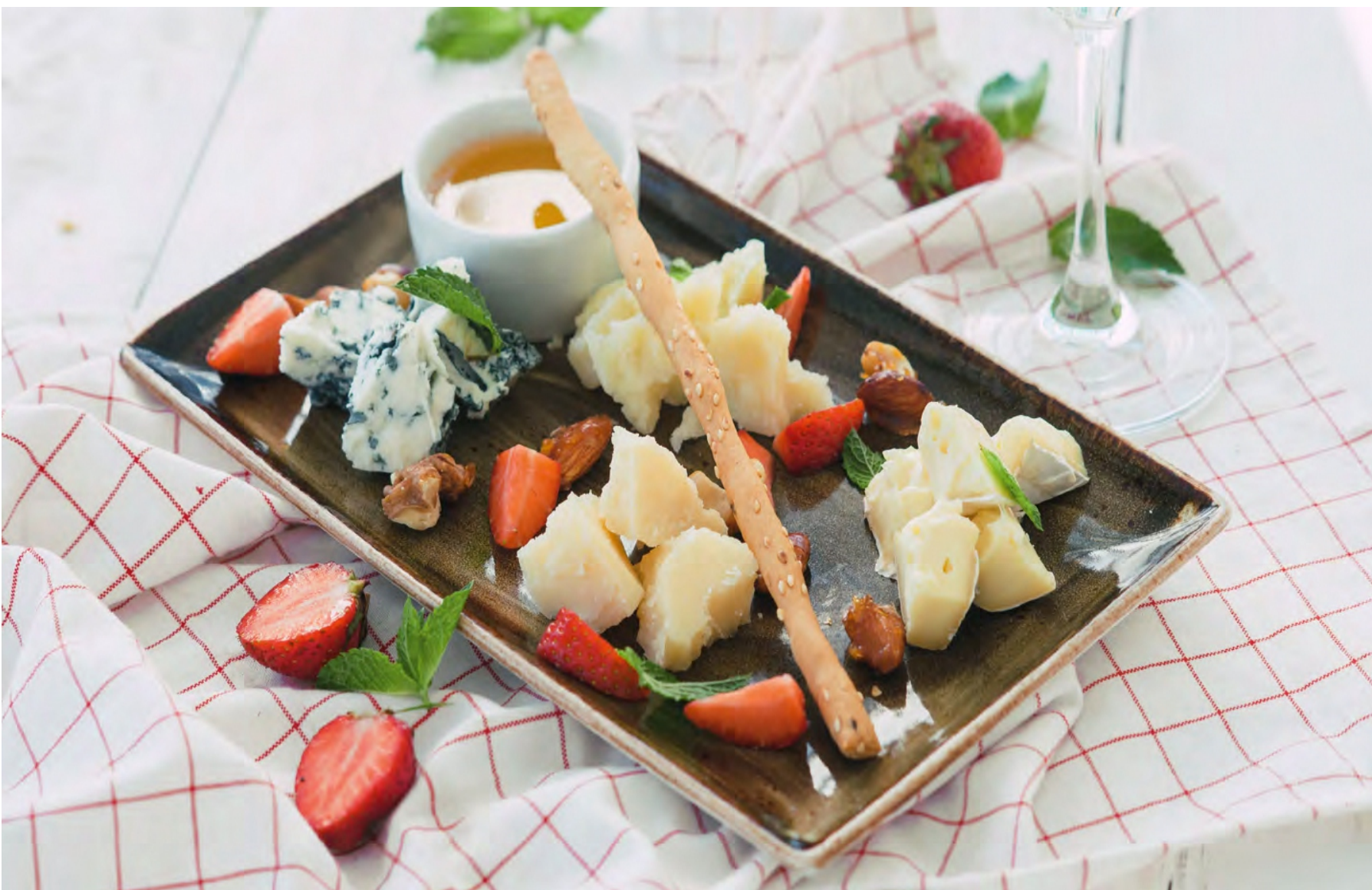
АССОРТИ ИЗ ВЫДЕРЖАННЫХ СЫРОВ - 200гр - 900руб