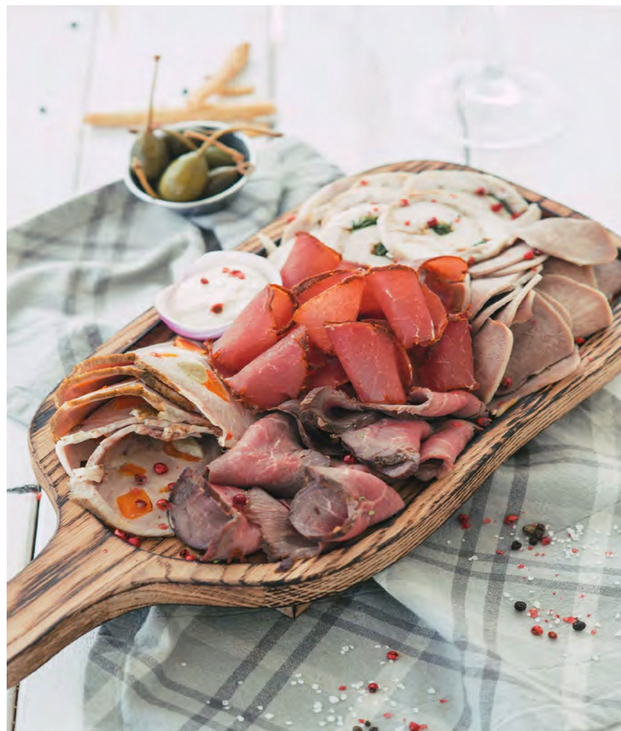
АССОРТИ ГАСТРОНОМИЧЕСКОЕ - 250гр - 850руб