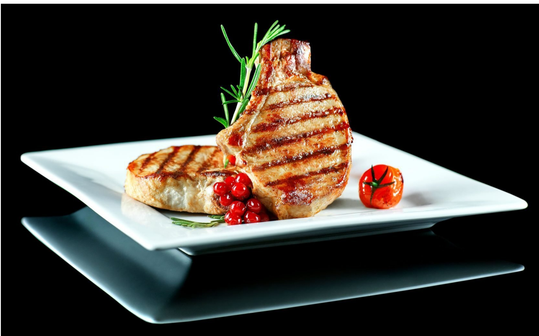
ОТБОРНАЯ СВИНАЯ КОРЕЙКА ГРИЛЬ - 200/50/30 - 680руб