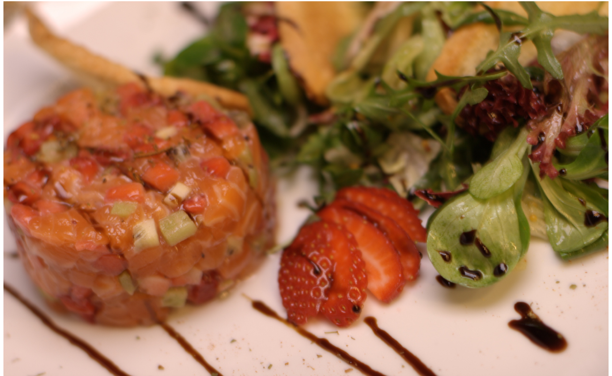
ТАР - ТАР ИЗ ЛОСОСЯ - 200/50/30гр - 950руб