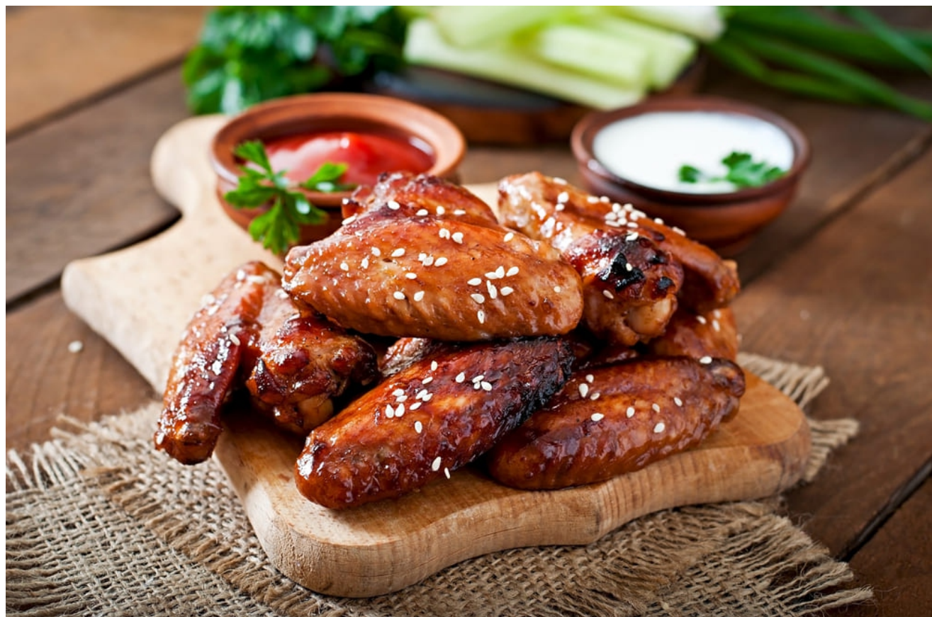
КРЫЛЬЯ ТЕРИЯКИ ИЛИ БАФФАЛО