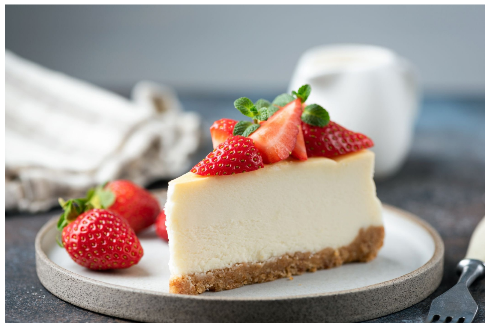
ЧИЗКЕЙК КЛАССИЧЕСКИЙ - 150гр - 350руб