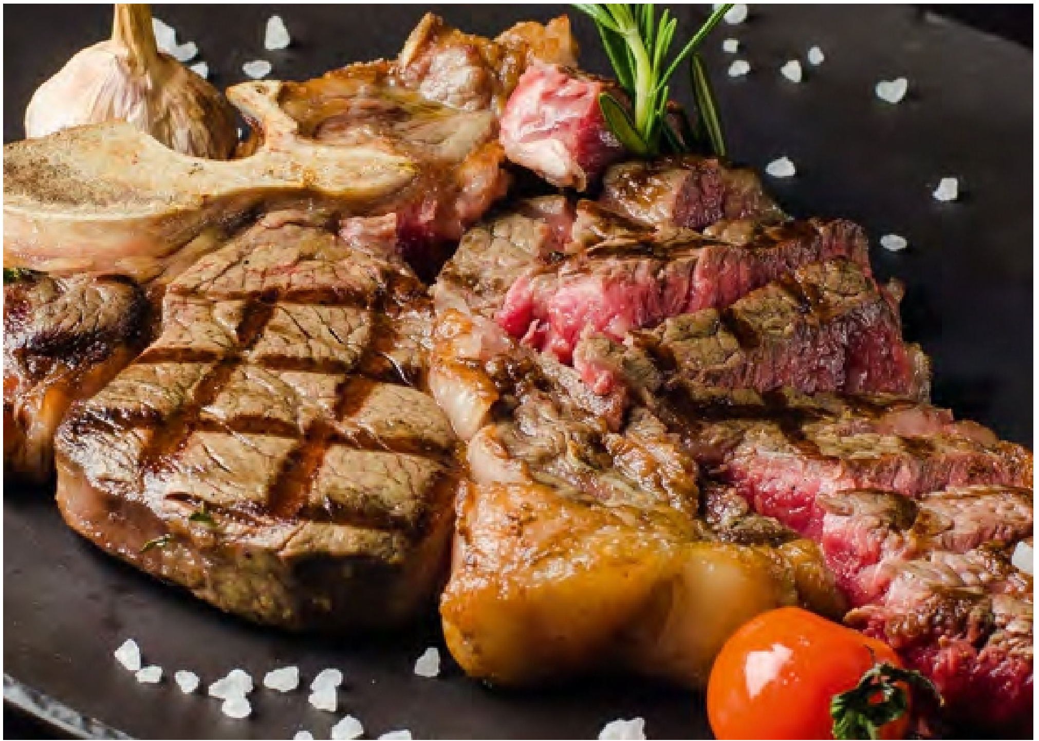
СТЕЙК ИЗ ГОВЯДИНЫ НА ГРИЛЕ (степень прожарки уточняйте) - 200/50/30гр - 980руб