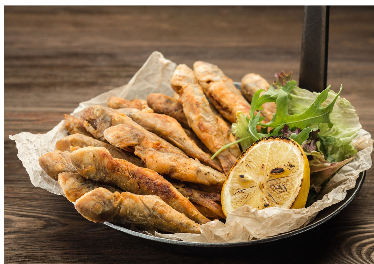
БЫЧКИ ПО ОДЕССКИ - 200/50/30 - 480руб