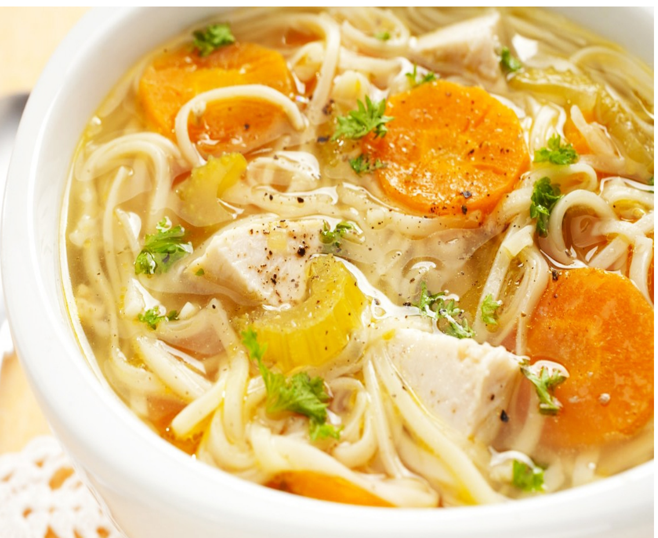
КУРИНЫЙ СУП С ЛАПШОЙ - 350гр - 250руб