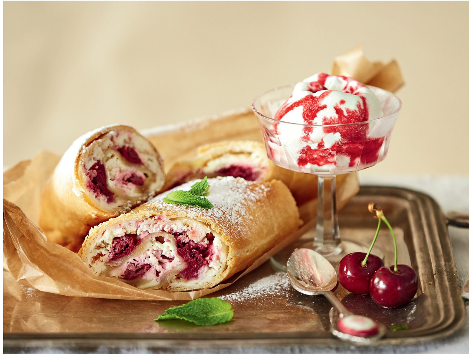
ШТРУДЕЛЬ ВИШНЁВЫЙ - 200/50/30гр - 450руб