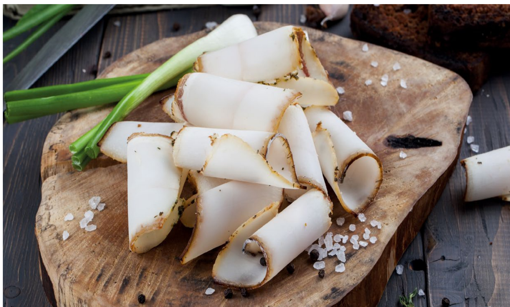
САЛО ПОД ВОДОЧКУ С ГРЕНКАМИ И ЧЕСНОКОМ - 100/100гр - 650