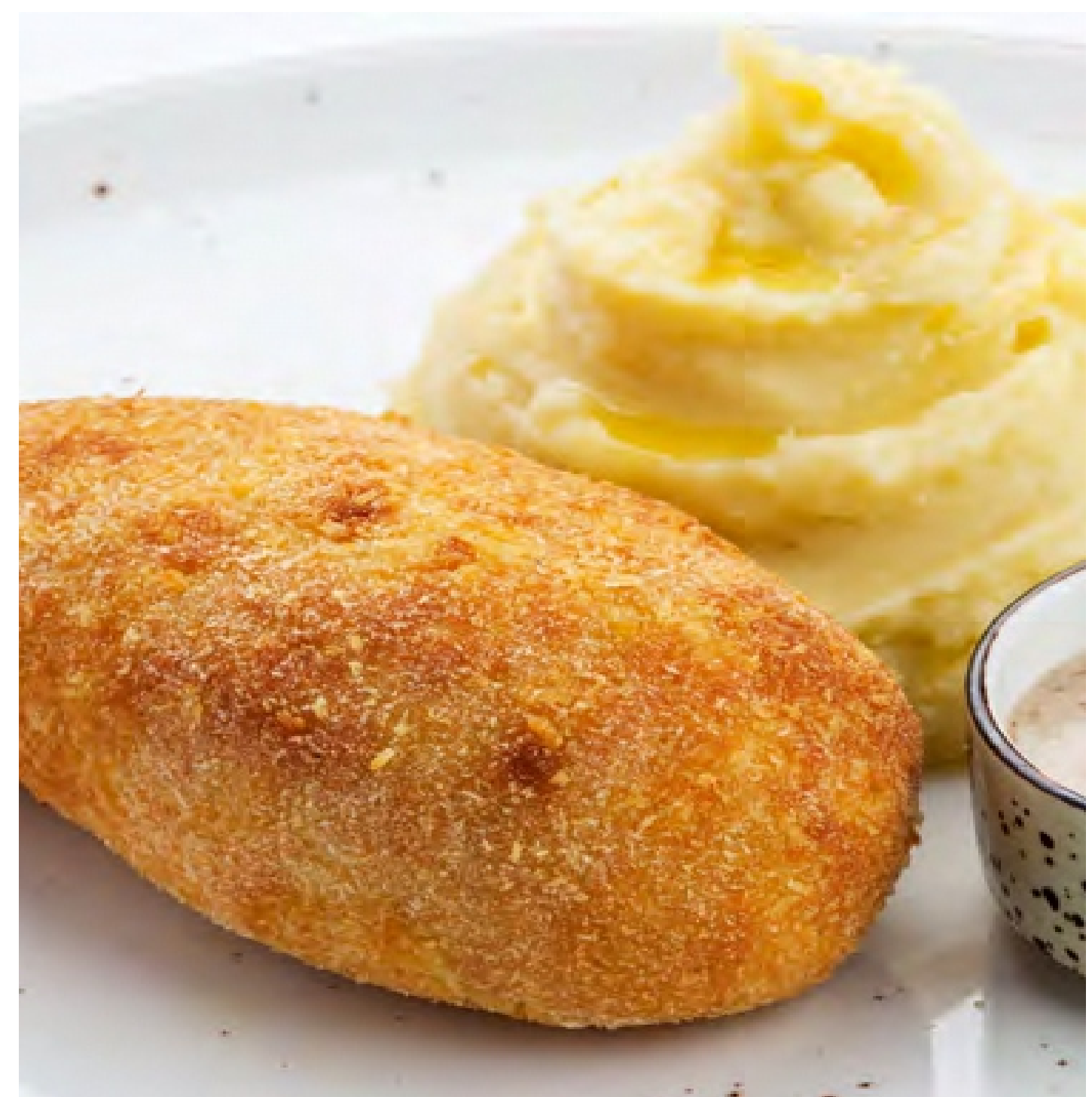
КОТЛЕТА ПО-КИЕВСКИ С КАРТОФЕЛЬНЫМ ПЮРЕ - 300гр - 480руб