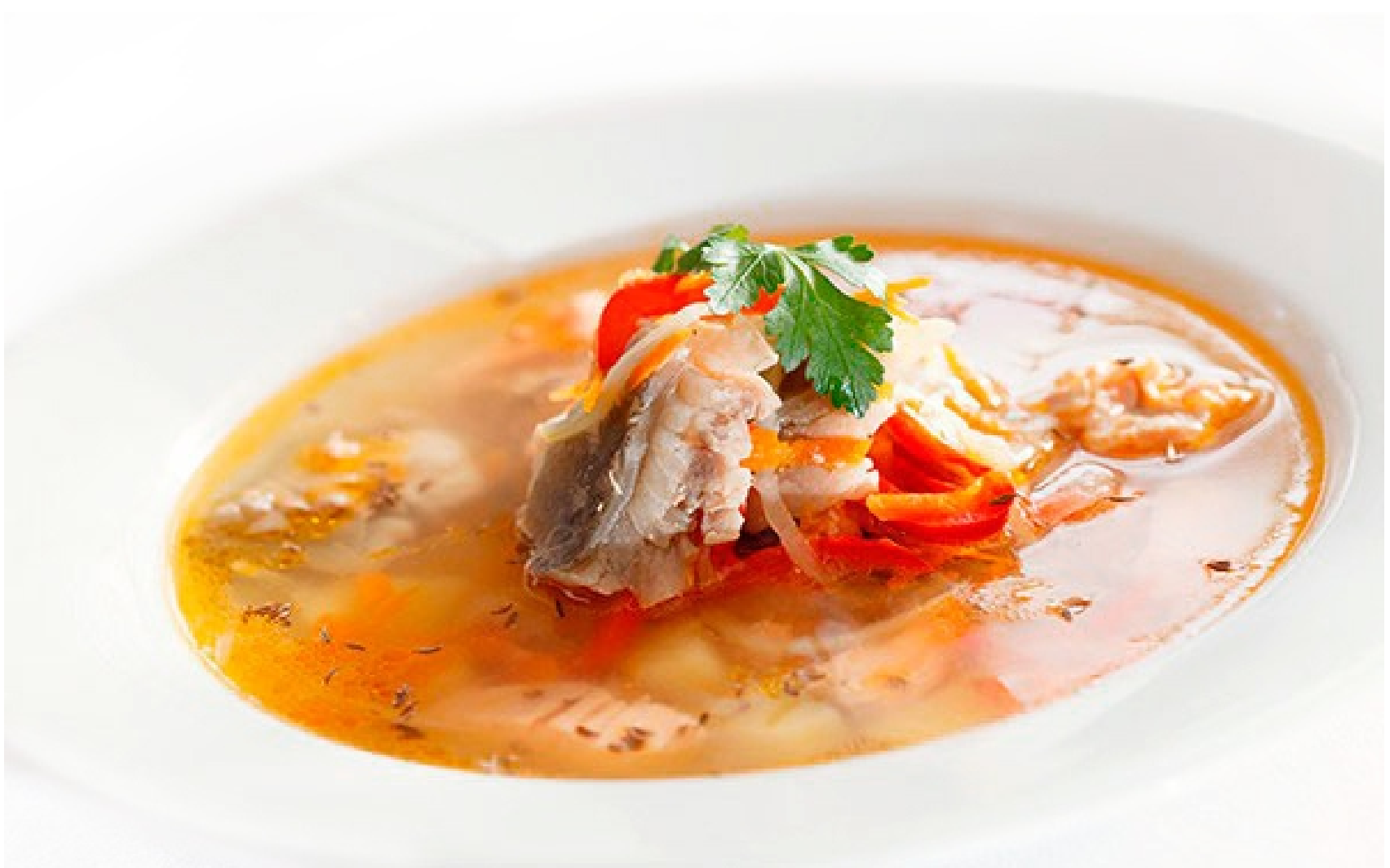
УХА РЫБАЦКАЯ ИЗ ТРЁХ ВИДОВ РЫБ С ВОДОЧКОЙ - 350гр - 280руб