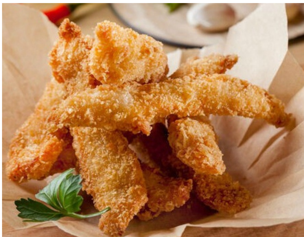
ФИШ & ЧИПС - 200 - 680руб