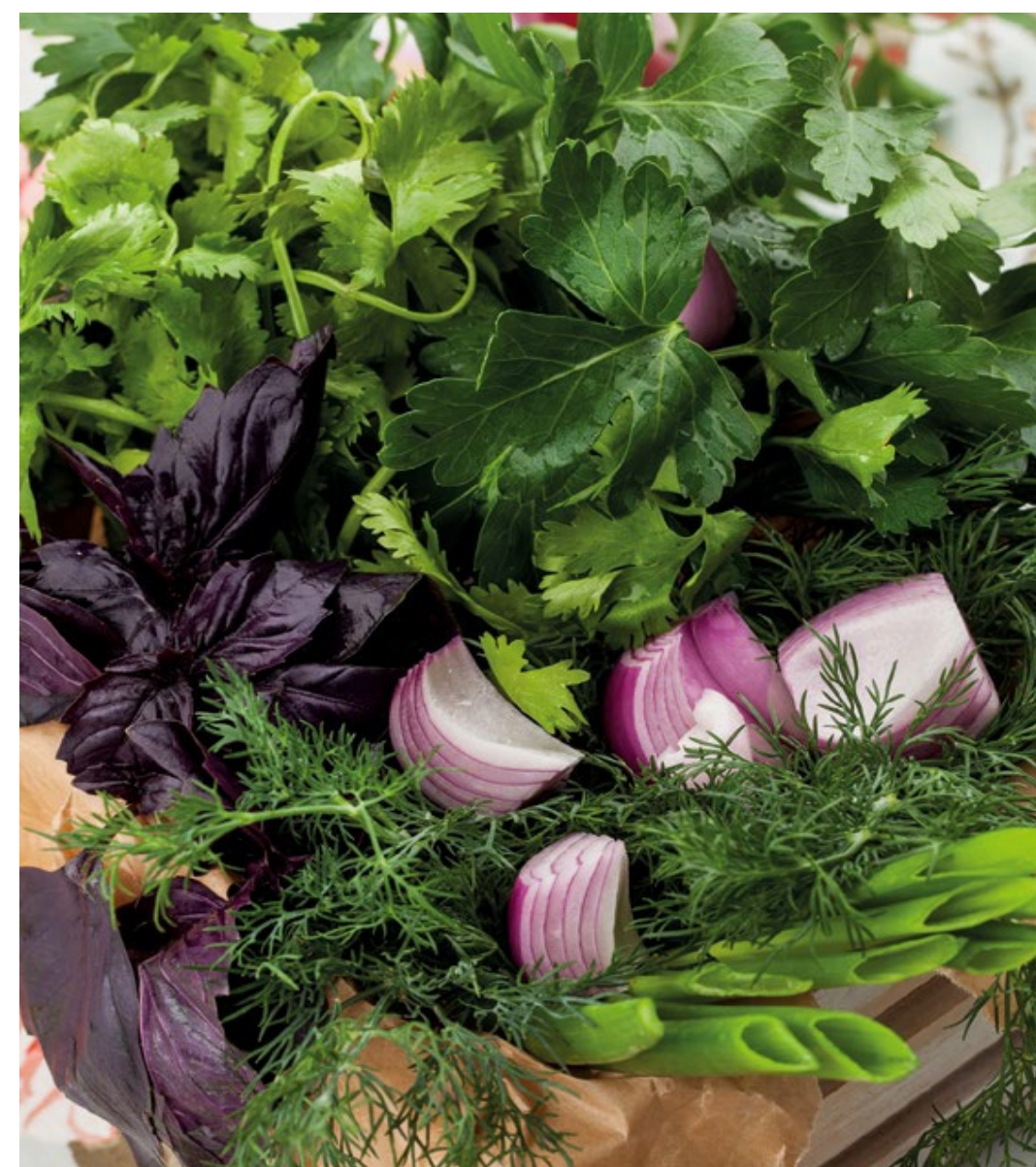
ТАРЕЛОЧКА ЗЕЛЕНИ - 30гр - 200руб