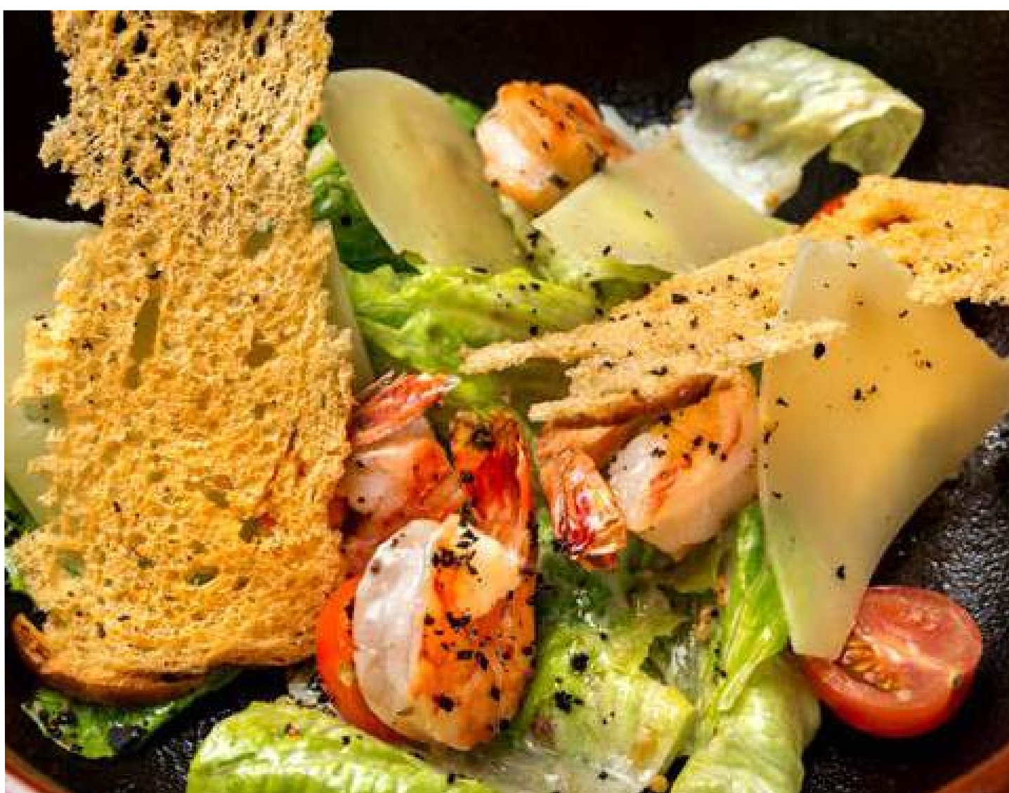
ЦЕЗАРЬ С КРЕВЕТКАМИ ИЛИ ЛОСОСЕМ - 300гр - 670руб

ДОРОГИЕ ГОСТИ БЛЮДА НА ФОТОГРАФИЯХ В МЕНЮ МОГУТ ОТЛИЧАТЬСЯ ОТ ОРИГИНАЛА