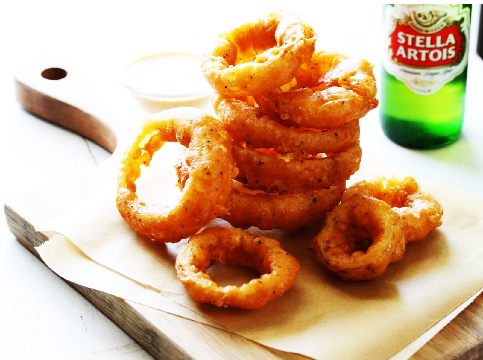
КОЛЬЦА КАЛЬМАРА С СОУСОМ ИЗ КАПЕРСОВ