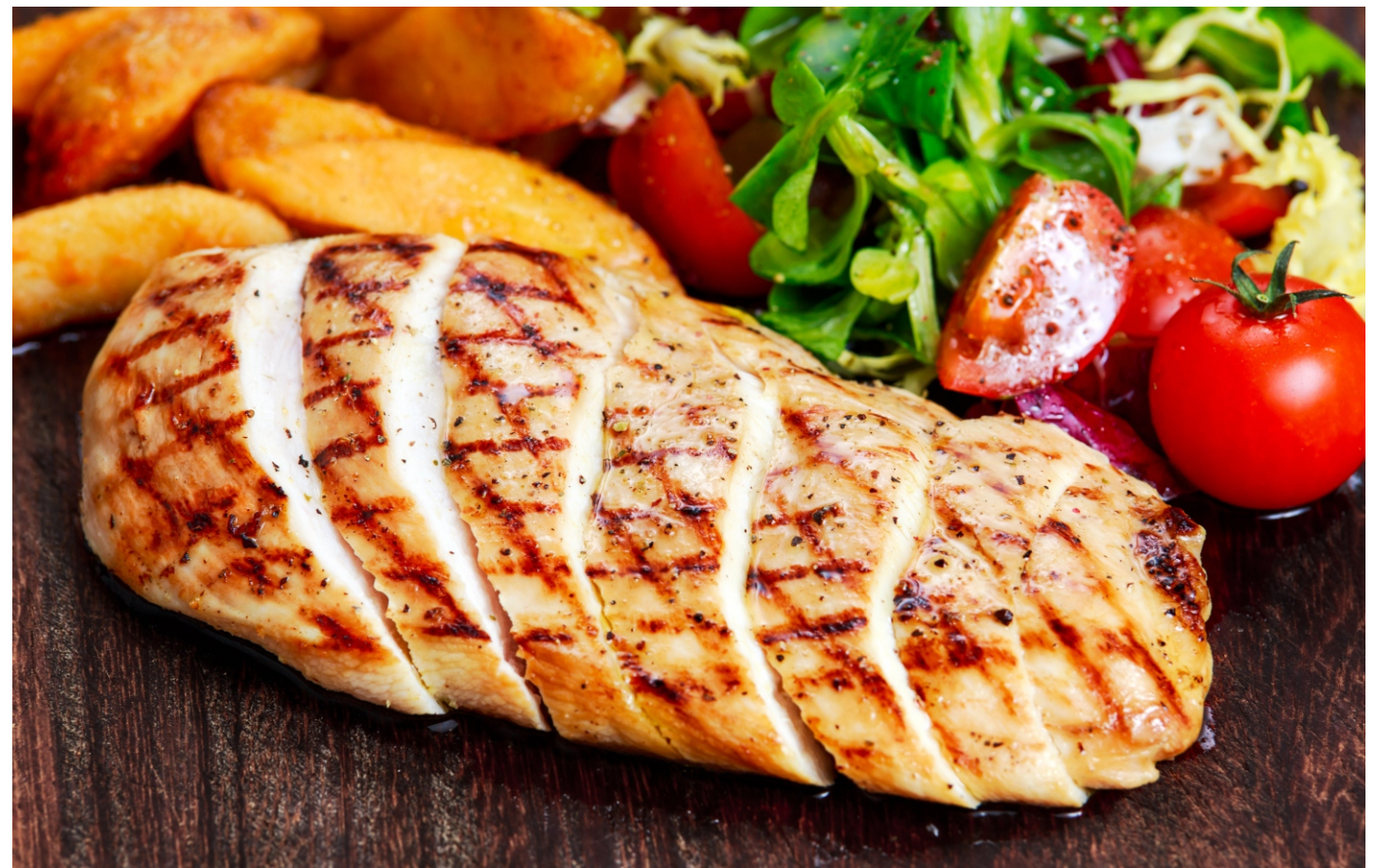
СТЕЙК ИЗ КУРИНОГО ФИЛЕ - 200/30/30гр - 480руб