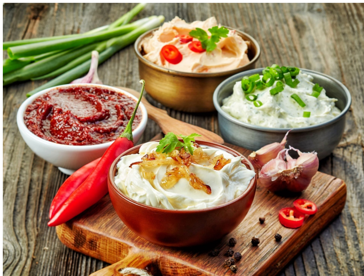
СОУСЫ НА ВЫБОР - 80 руб