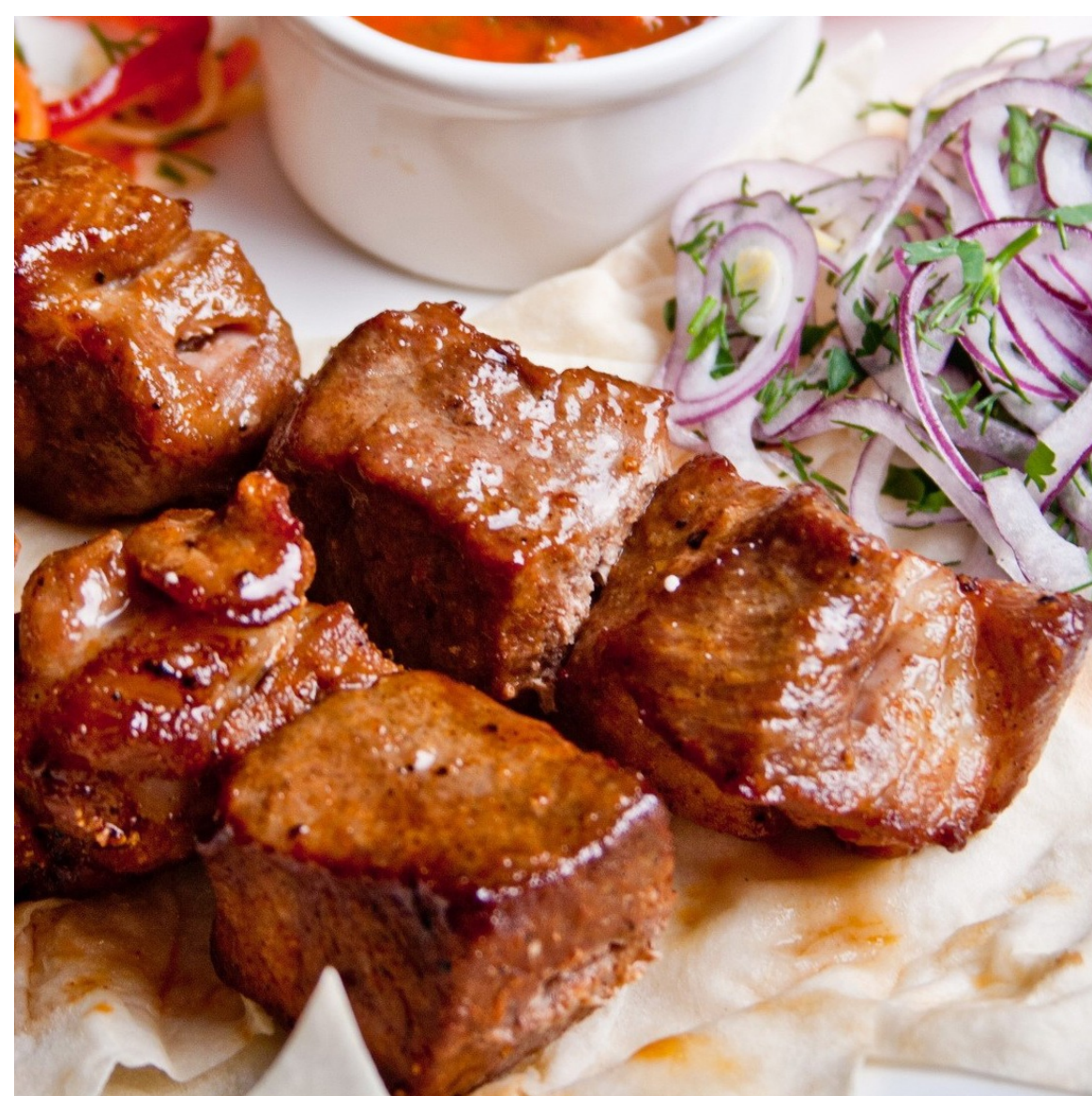
ШАШЛЫК СВИНОЙ - 200/50/30 - 680руб.