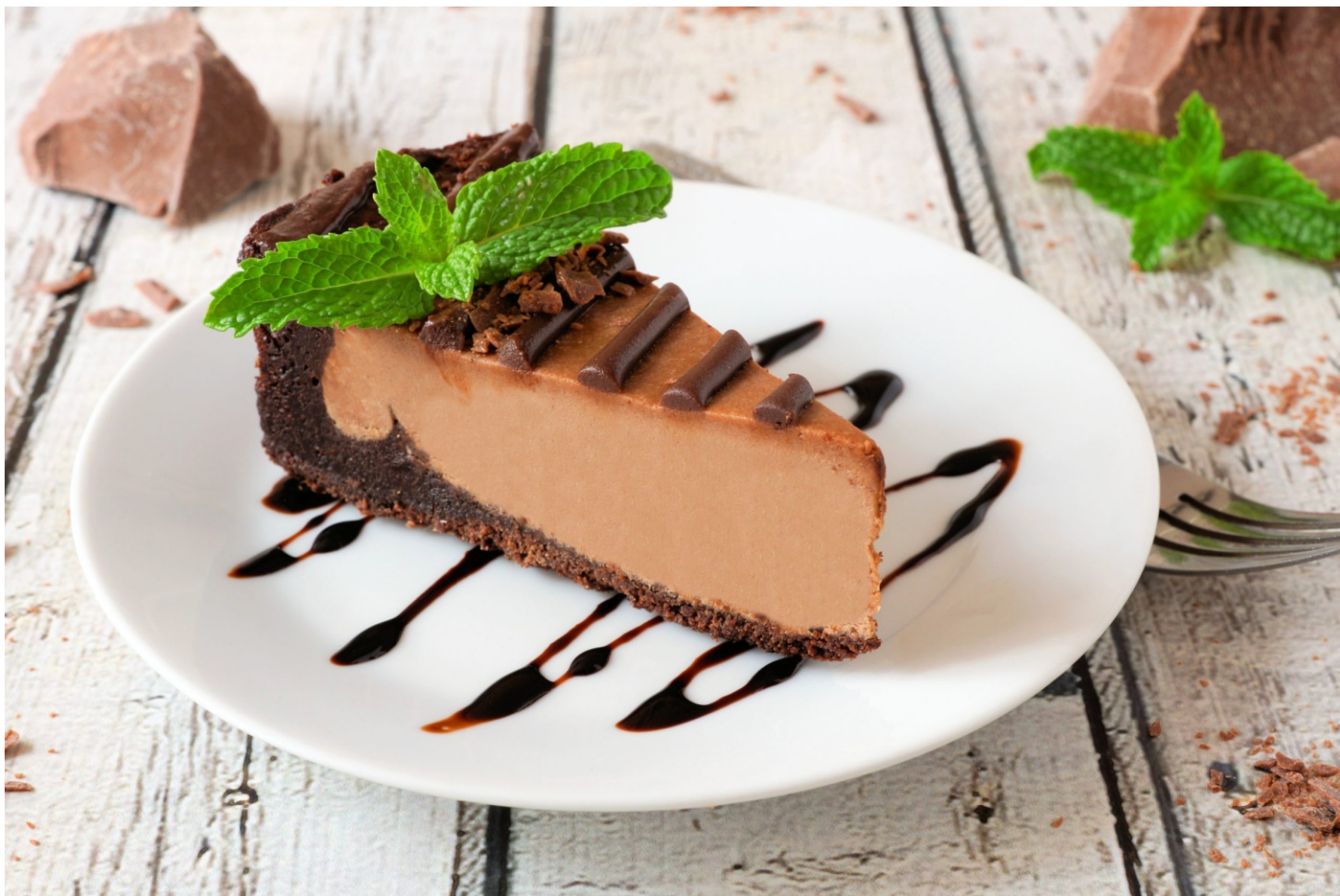
ЧИЗКЕЙК ШОКОЛАДНЫЙ - 150гр - 350руб