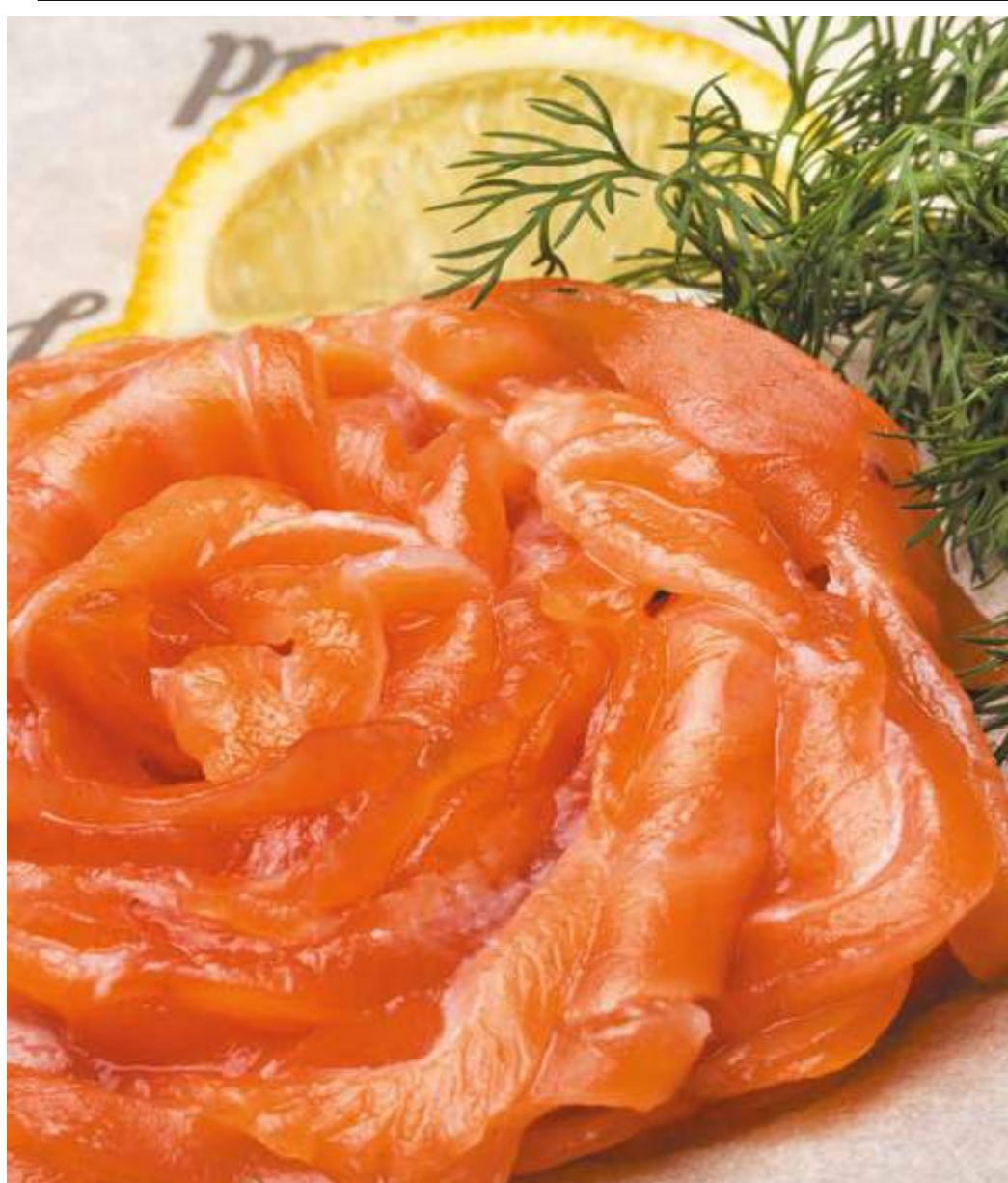
ЛОСОСЬ ШЕФ-ПОСОЛА - 100/50гр - 650руб