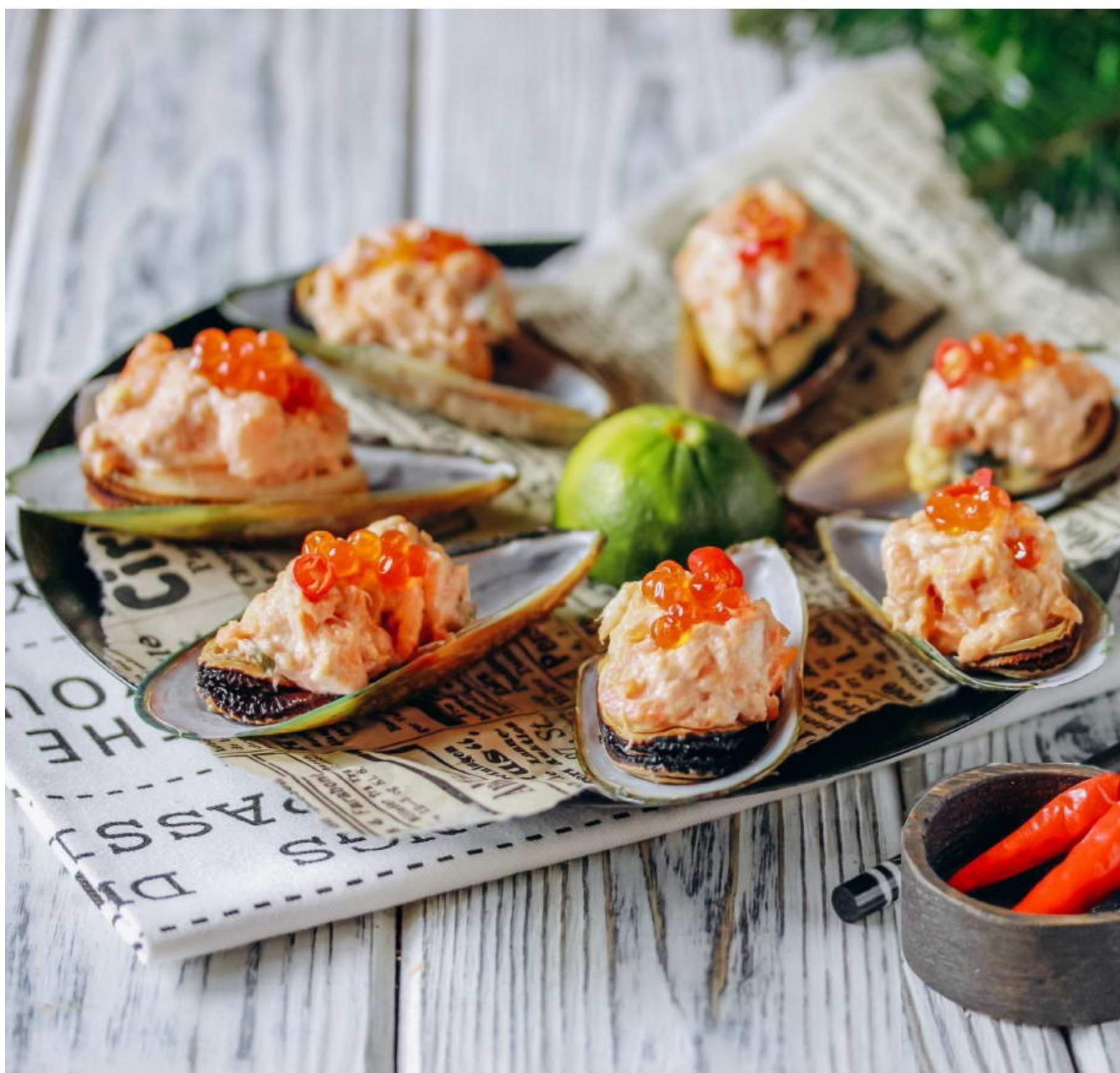
МИДИИ ЗАПЕЧЕННЫЕ ПОД СЫРНЫМ СОУСОМ - 350гр - 750руб