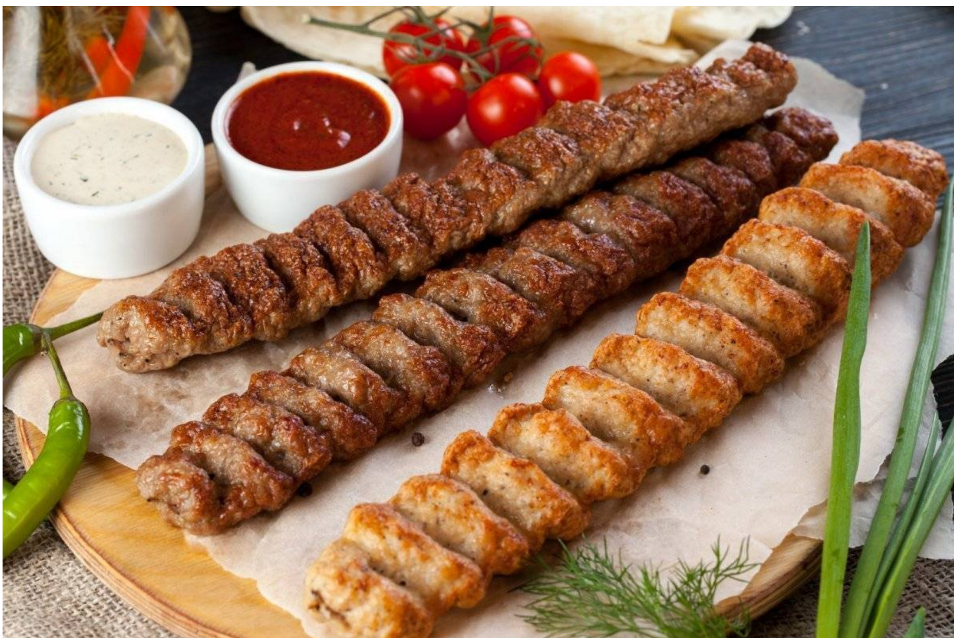
ЛЮЛЯ-КЕБАБ - КУРИНЫЙ - 250/50/30 - 680 руб. ; СВИНОЙ - 250/50/30 - 780 руб