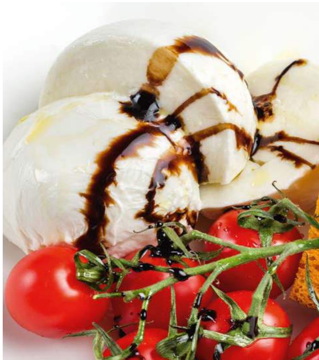
КАПРЕЗЕ - 300гр - 510руб