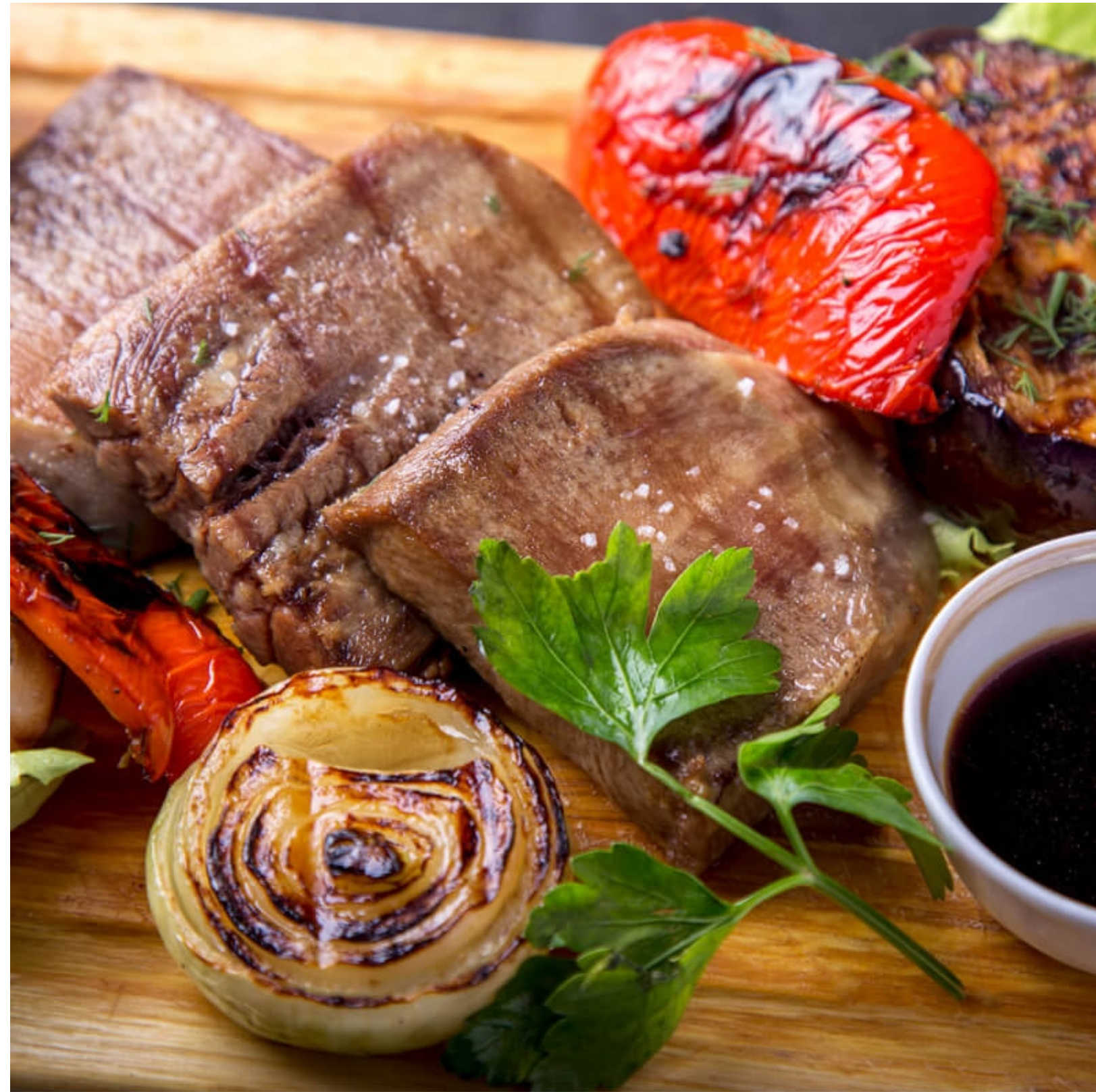
ЯЗЫК ГОВЯЖИЙ НА ГРИЛЕ С ОВОЩАМИ - 150/100гр - 800руб