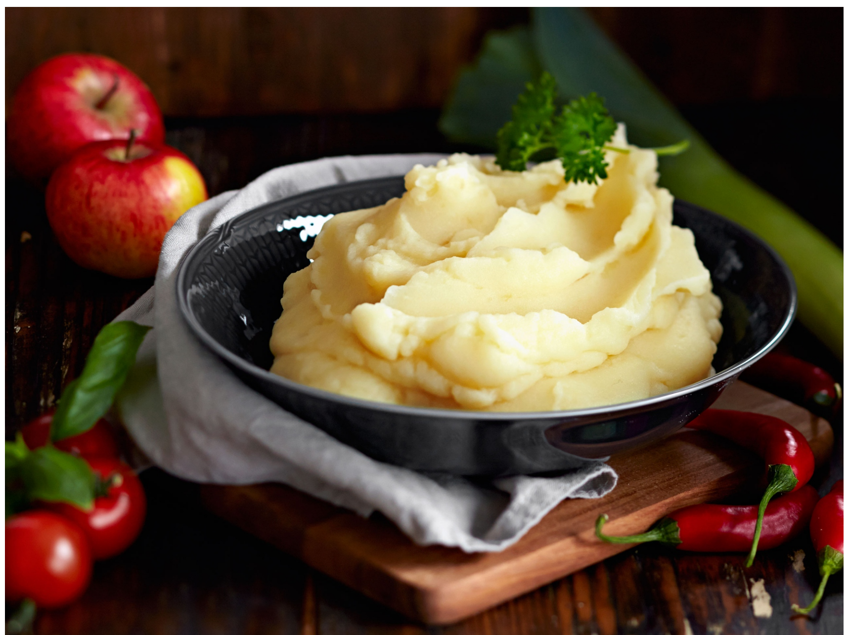
КАРТОФЕЛЬНОЕ ПЮРЕ - 200/30 - 250руб