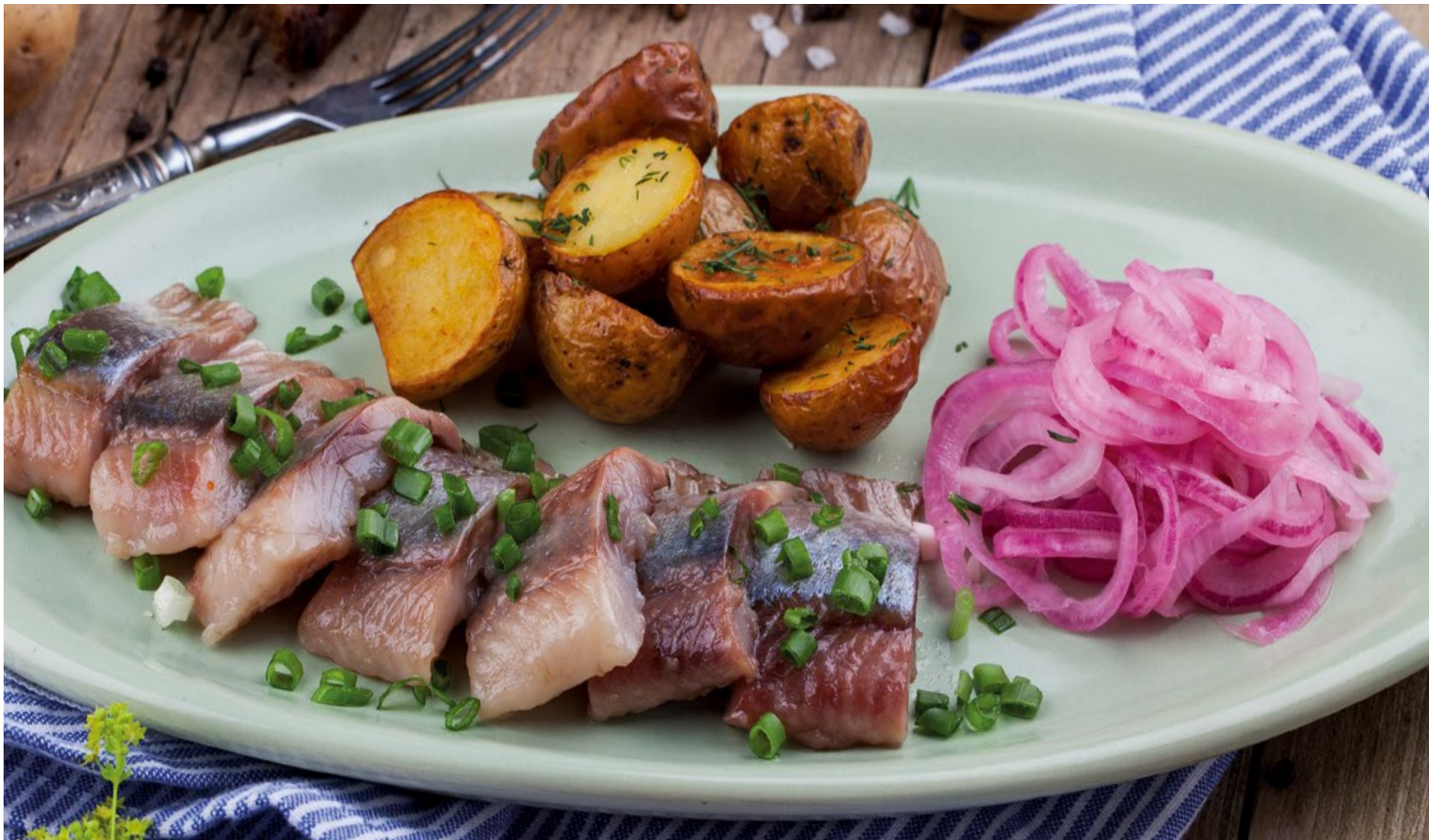
СЕЛЬДЬ АВТОРСКАЯ С ЗАПЕЧЁНЫМ КАРТОФЕЛЕМ И СВЕЖЕЙ ЗЕЛЕНЬЮ - 100/100/50/30гр - 350руб