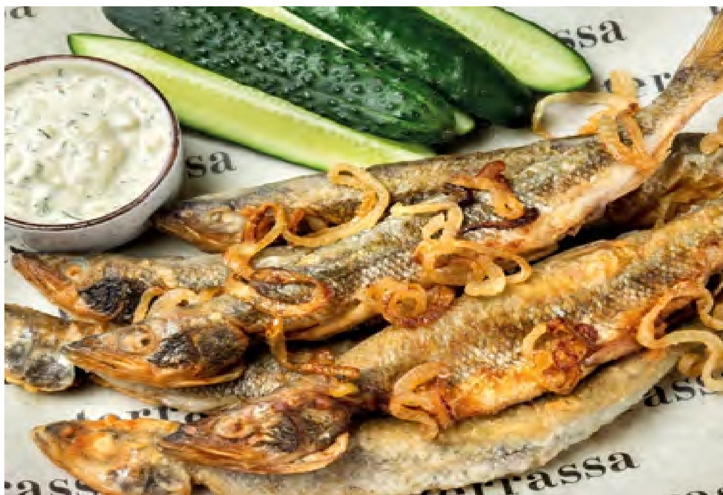
Мойва по домашнему - 200/50/30 - 480руб