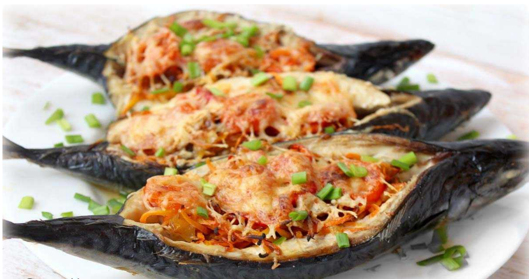
СКУМБРИЯ ЗАПЕЧЁННАЯ С ОВОЩАМИ И СЫРОМ - 350гр - 770руб