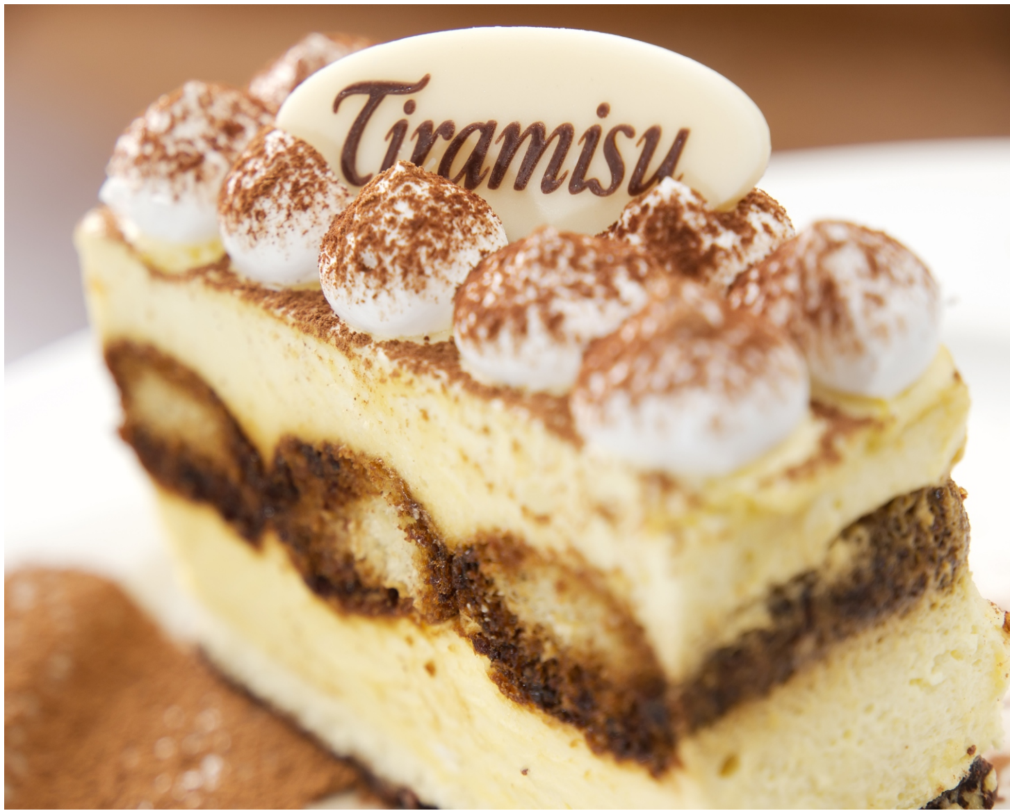
ТИРАМИСУ - 200гр - 300руб