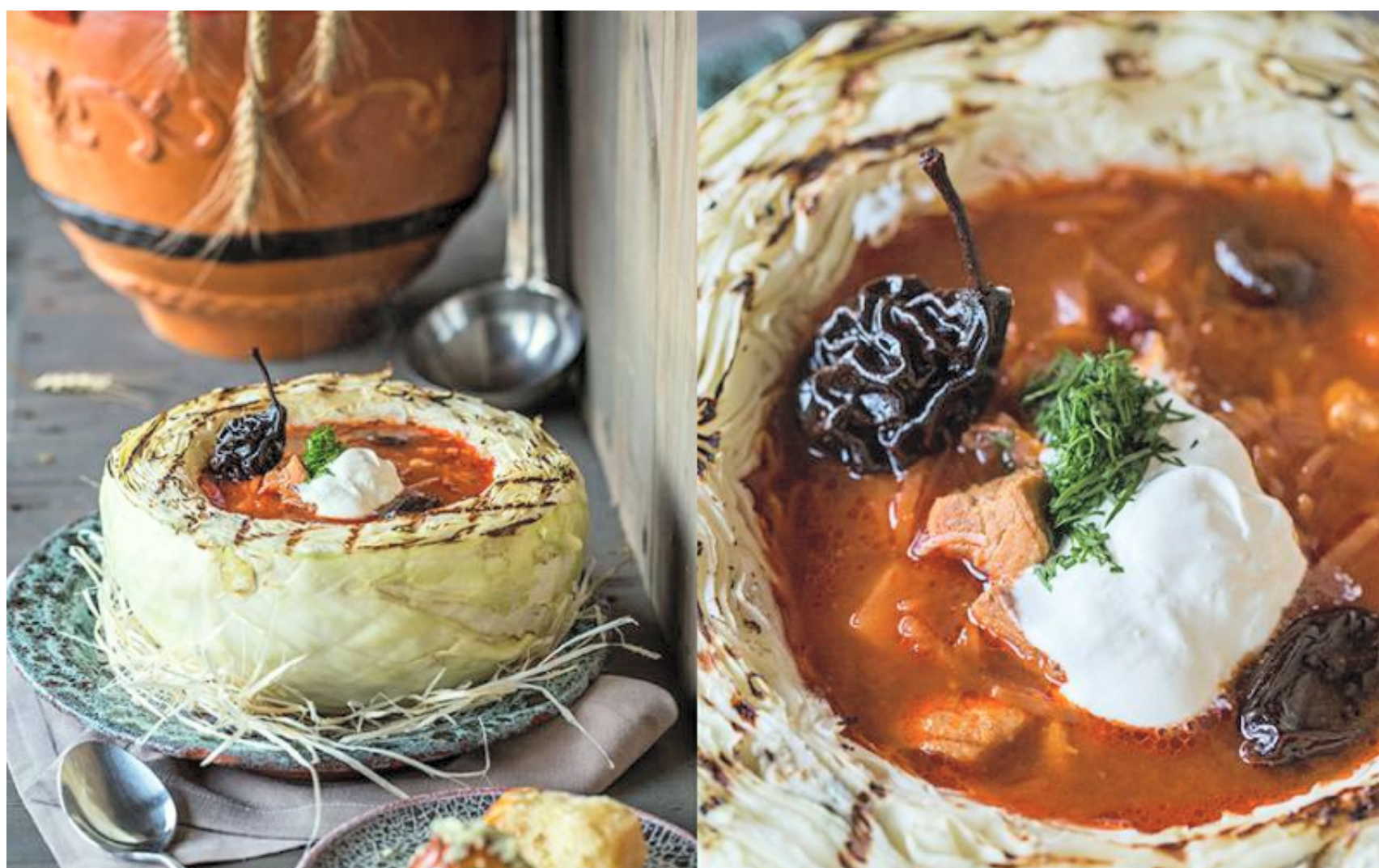
БОРЩ ОДЕССКИЙ - 350гр - 280руб