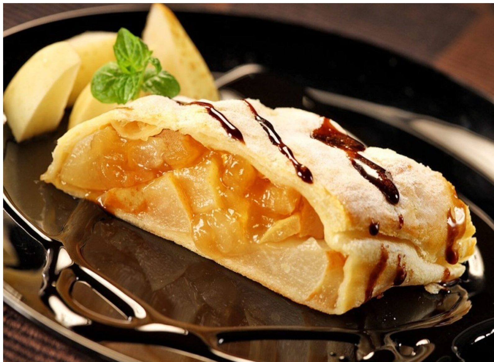
ШТРУДЕЛЬ ЯБЛОЧНЫЙ - 200/50/30гр - 450руб