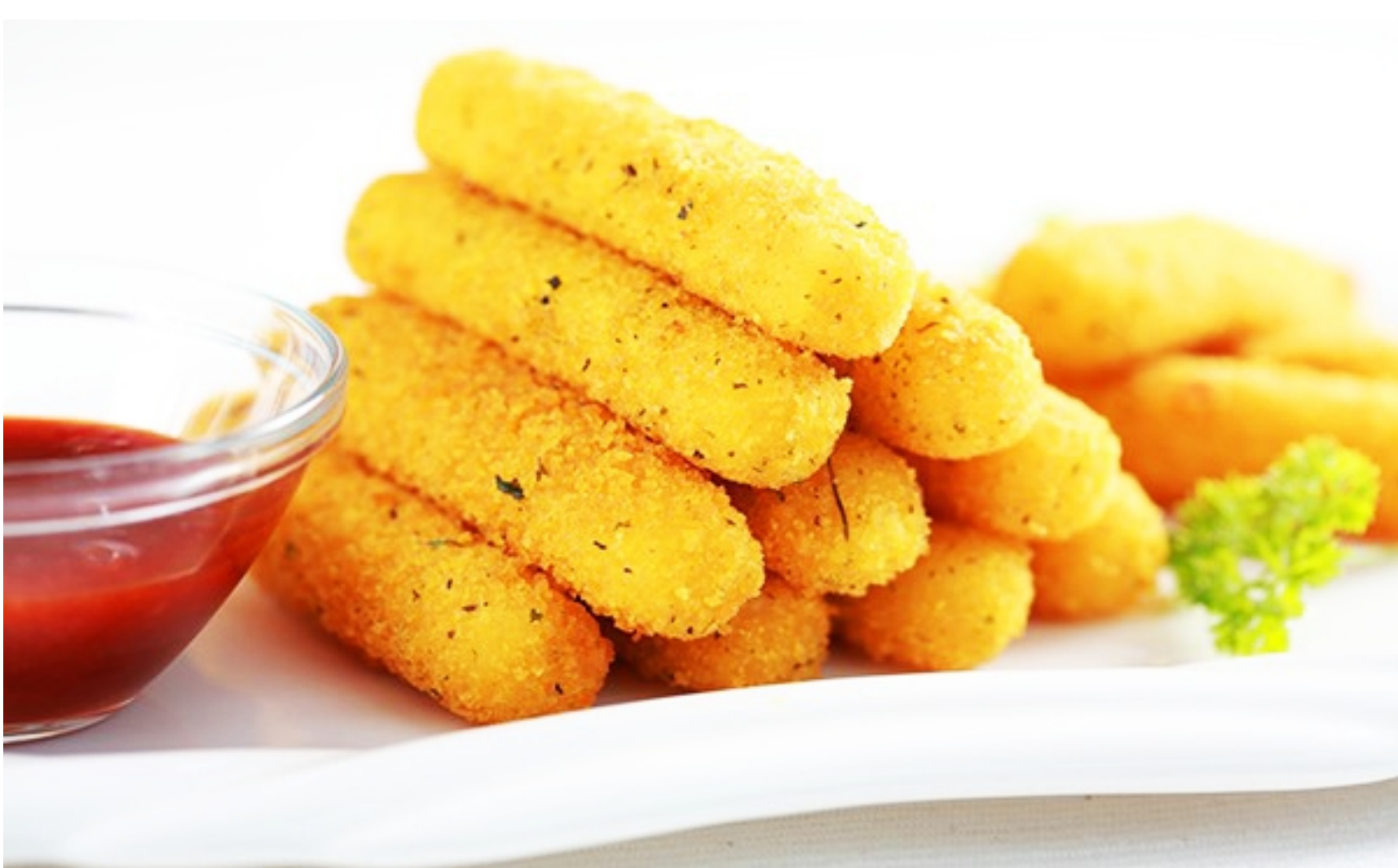
МОЦАРЕЛЛА С БЕКОНОМ И СОУСОМ БАРБЕКЬЮ - 250/50гр - 480 руб