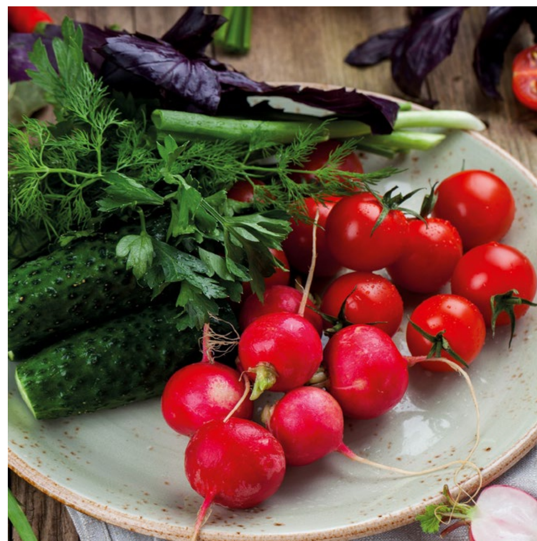
АССОРТИ ИЗ СВЕЖИХ ОВОЩЕЙ - 250гр - 450руб