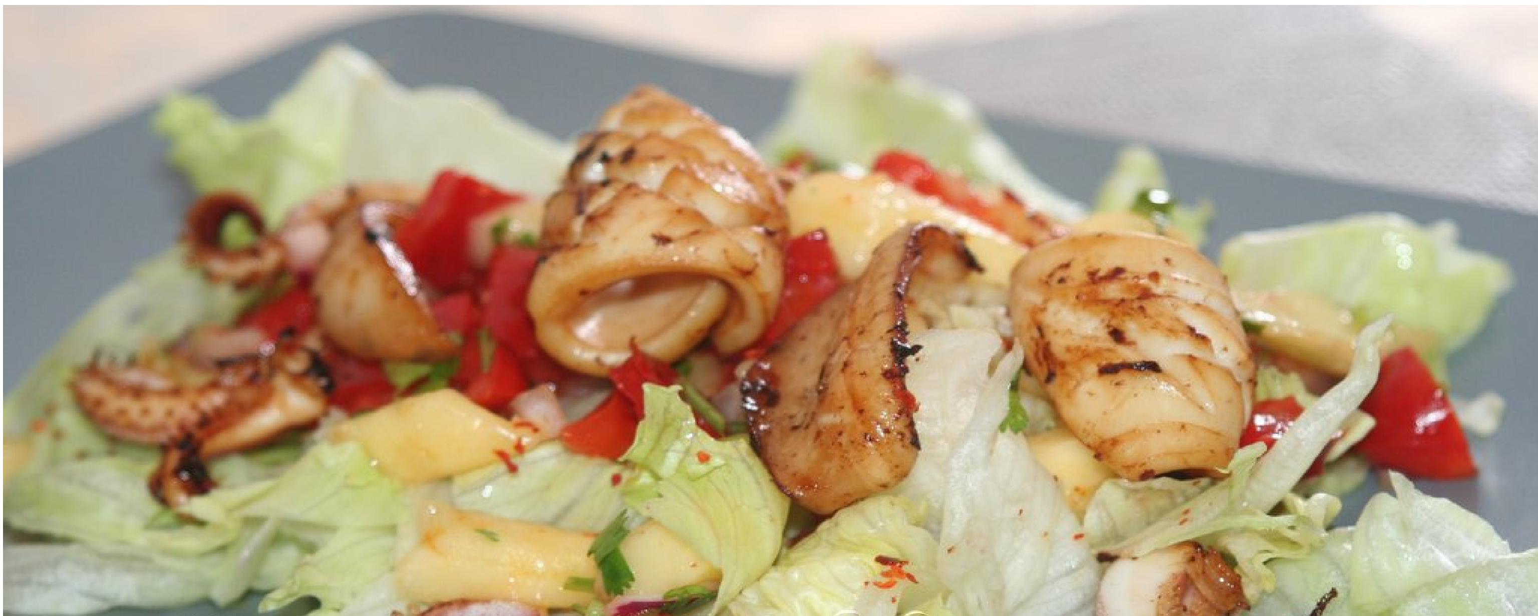
ЦЕЗАРЬ С КРЕВЕТКАМИ ИЛИ ЛОСОСЕМ - 300гр - 850руб