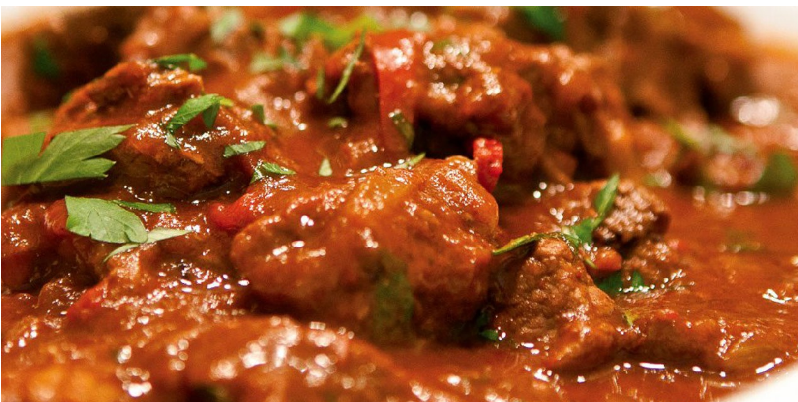
ГУЛЯШ АВСТРИЙСКИЙ ИЗ ГОВЯДИНЫ - 320гр - 720руб