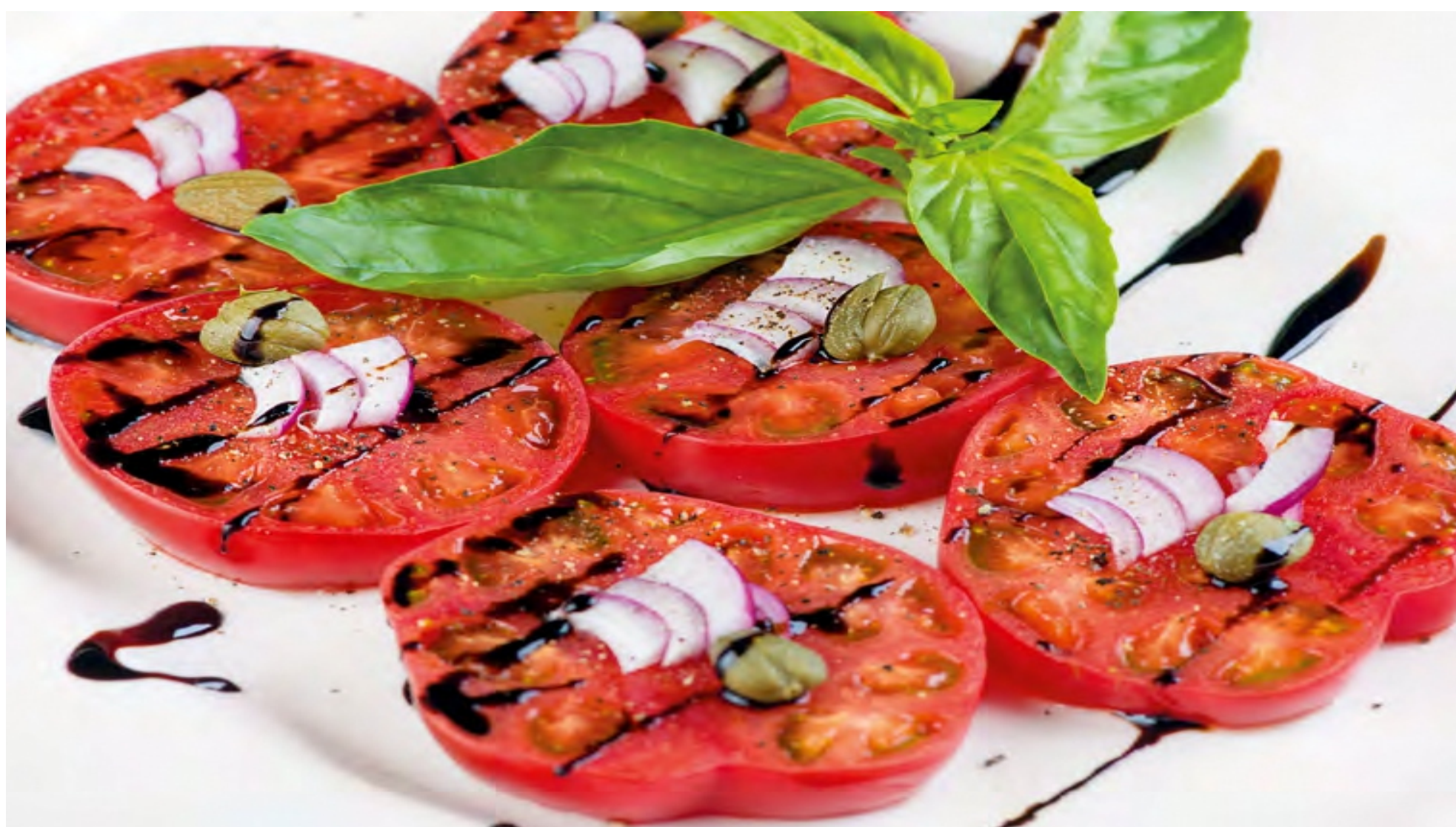
КАРПАЧО ИЗ ТОМАТОВ - 200/50/30гр - 350руб