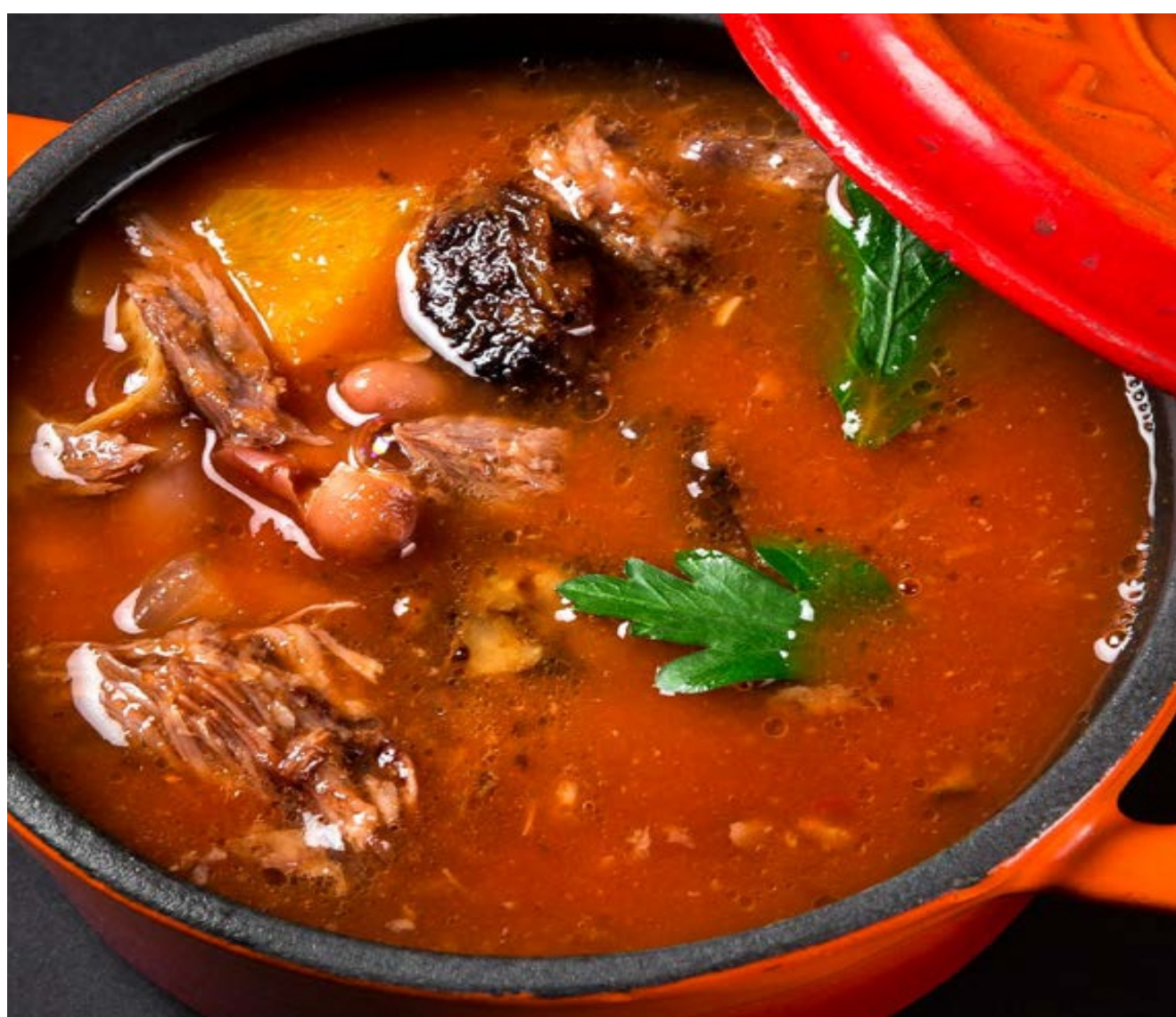
ТЕХАССКИЙ С РЕБРАМИ ВВQ - - 350гр - 280руб