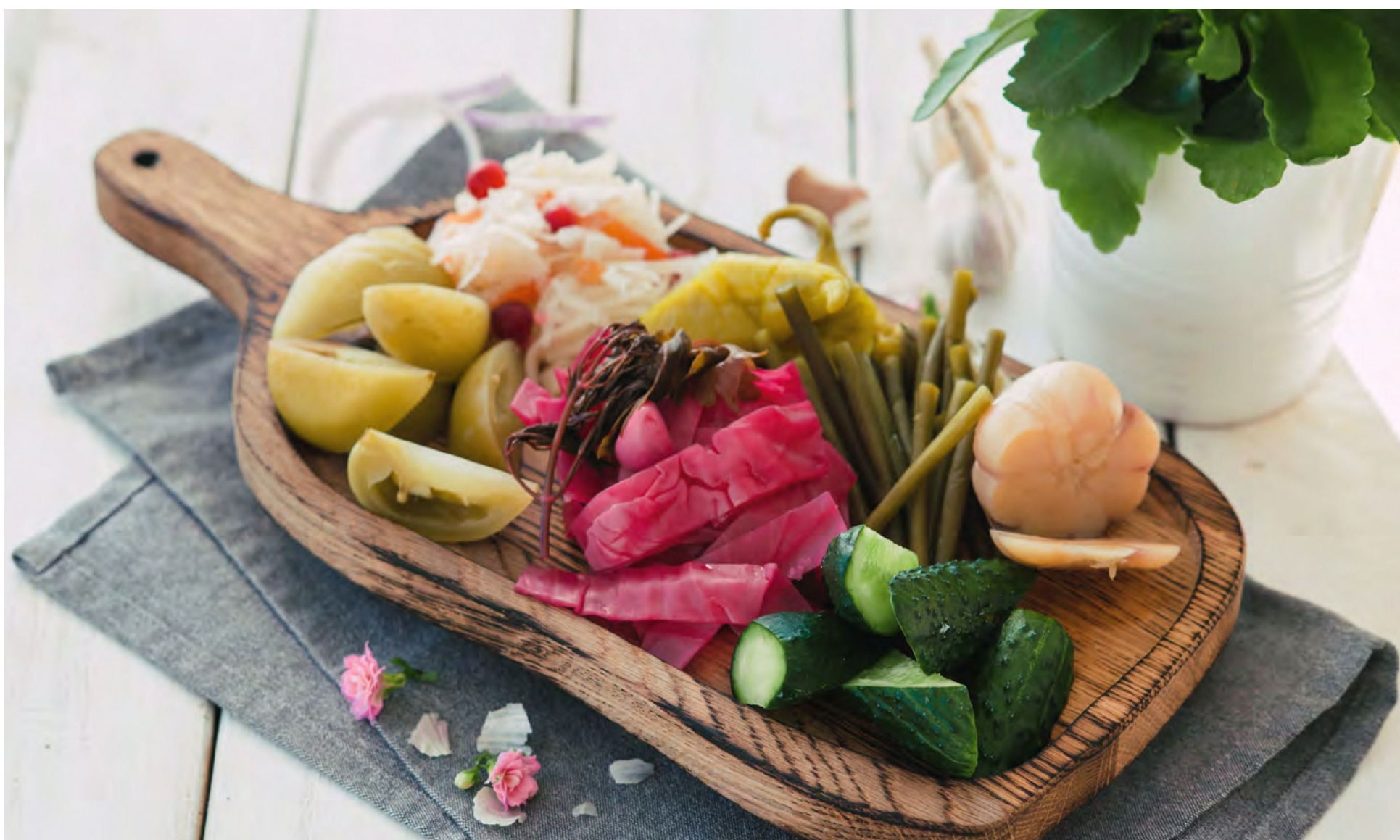
АССОРТИ ИЗ СОЛЕНИЙ - 500гр - 500руб