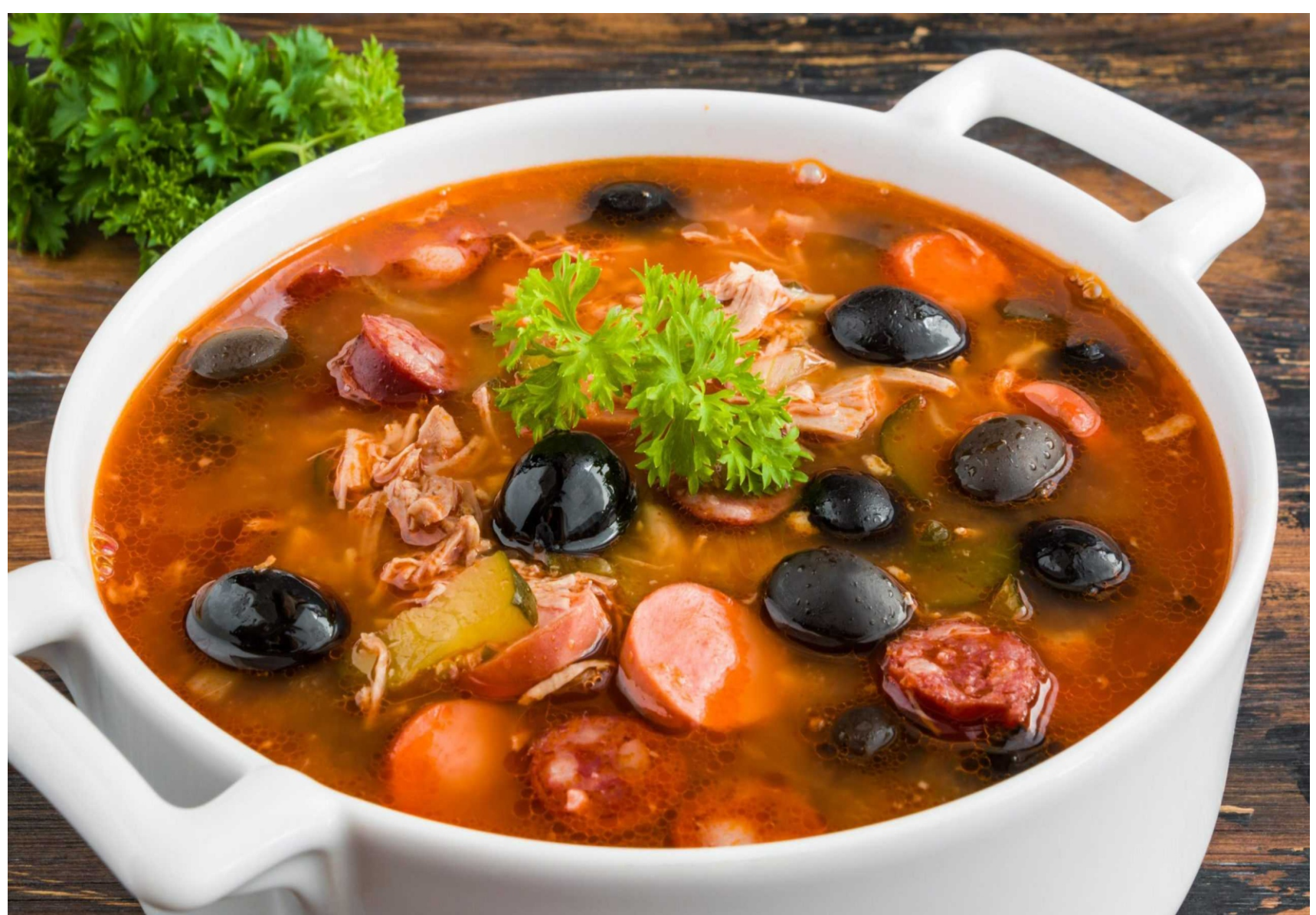
СОЛЯНКА МЯСНАЯ СБОРНАЯ - 350гр - 350руб