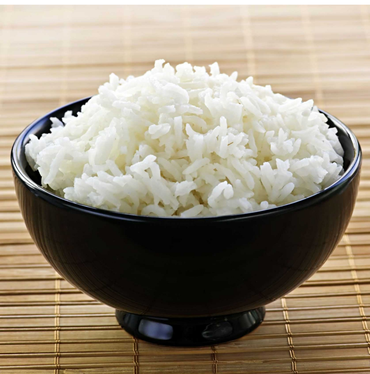
РИС ОТВАРНОЙ С МАСЛОМ - 200/30 - 250руб