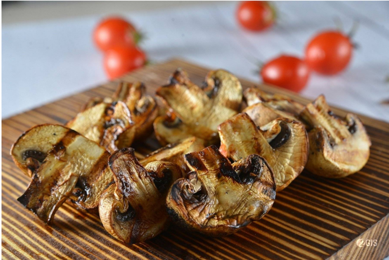
ШАМПИньОНЫ ГРИЛЬ - 200 - 250руб