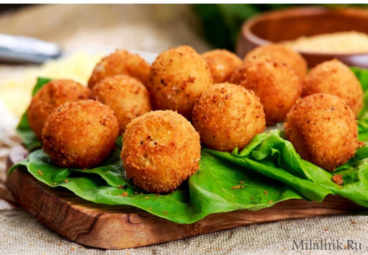
ШАМПИНЬОНЫ В СУХАРЯХ - 200/30гр - 350руб