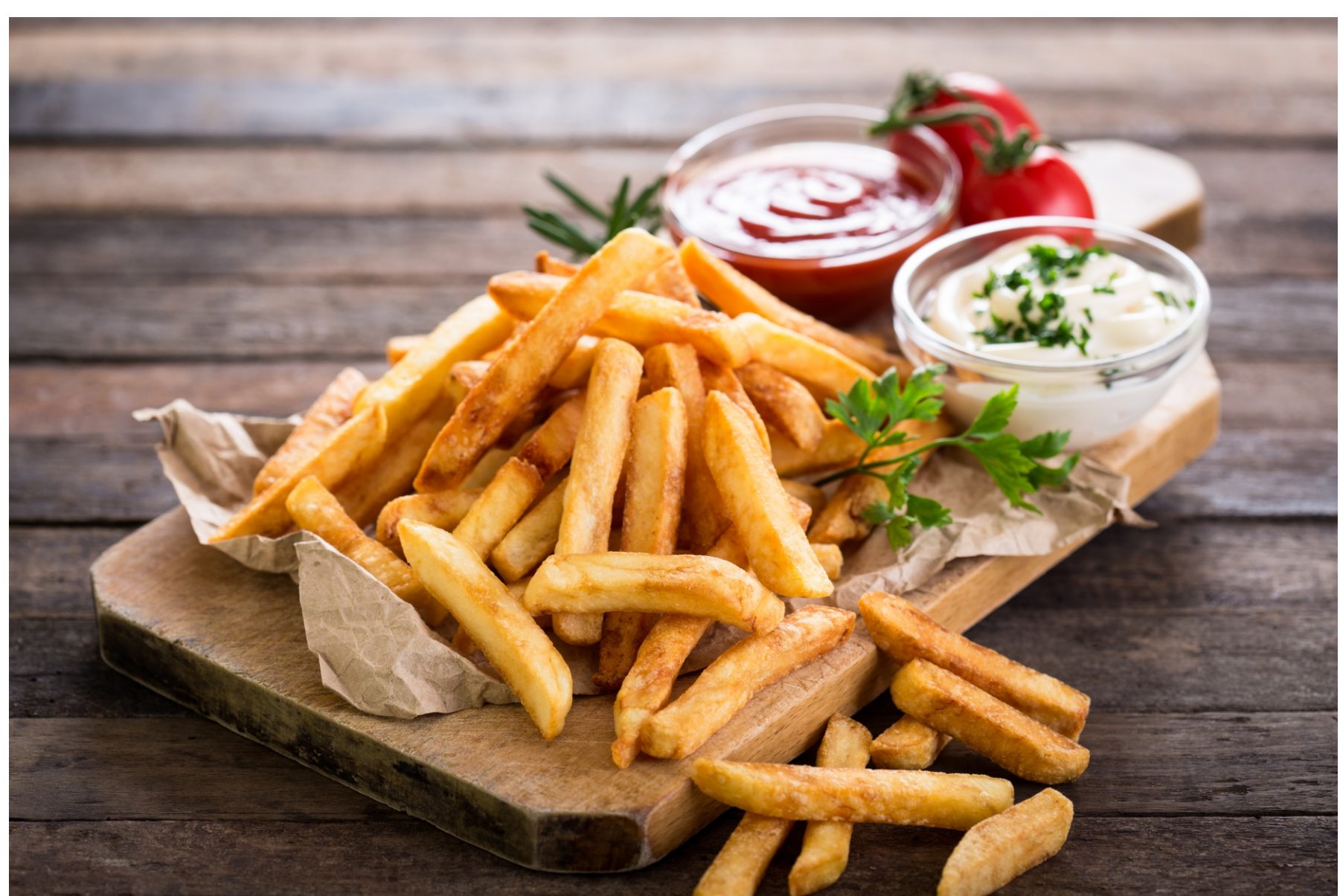
КАРТОФЕЛЬ ФРИ - 200/30 - 250руб