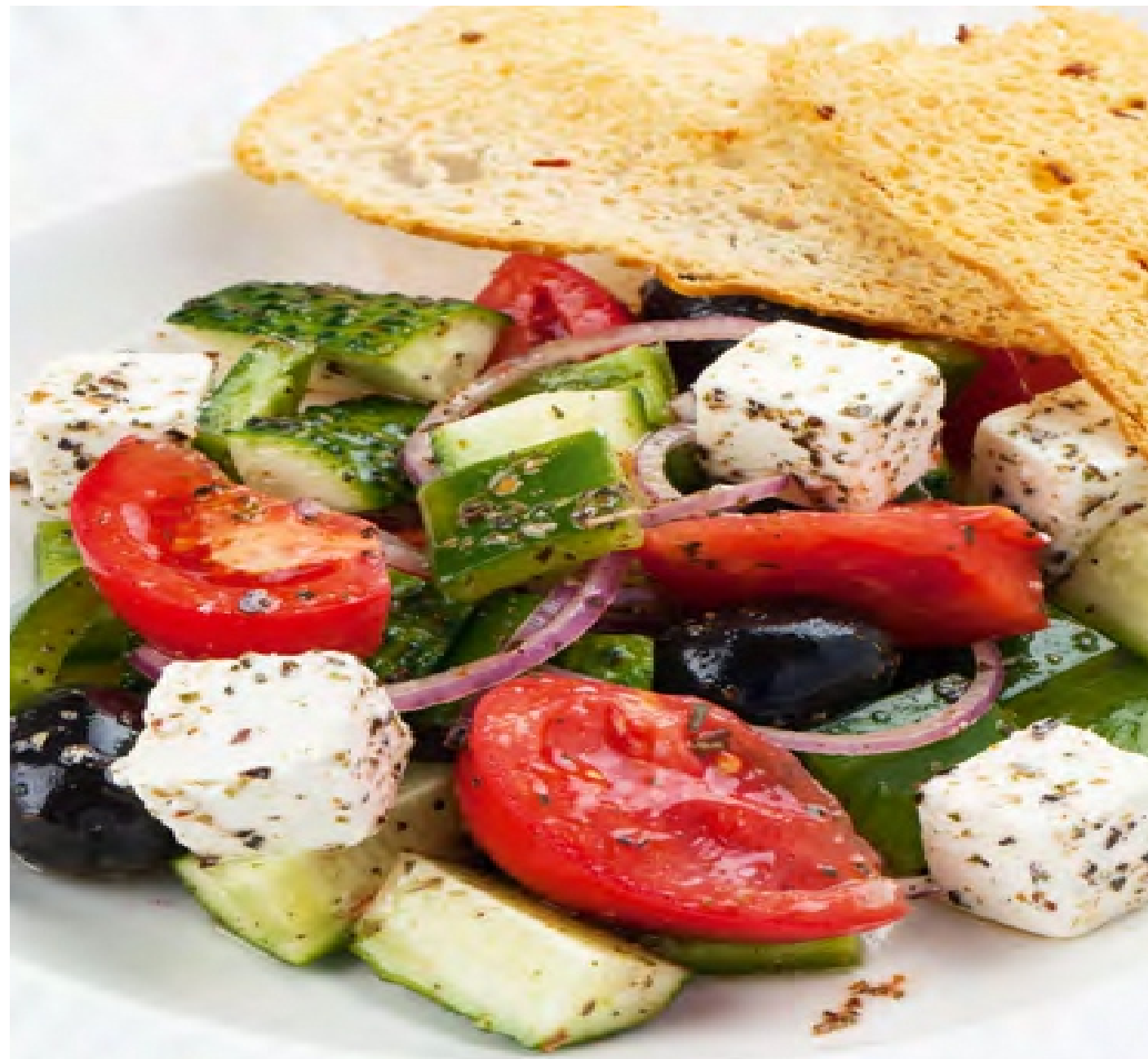
САЛАТ ГРЕЧЕСКИЙ - 330гр - 450 руб