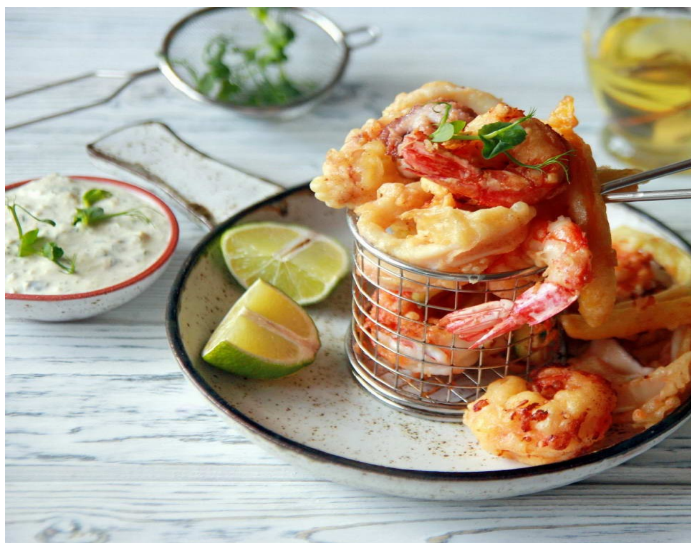
КРЕВЕТКИ В ТЕМПУРЕ - 200/30гр - 780руб