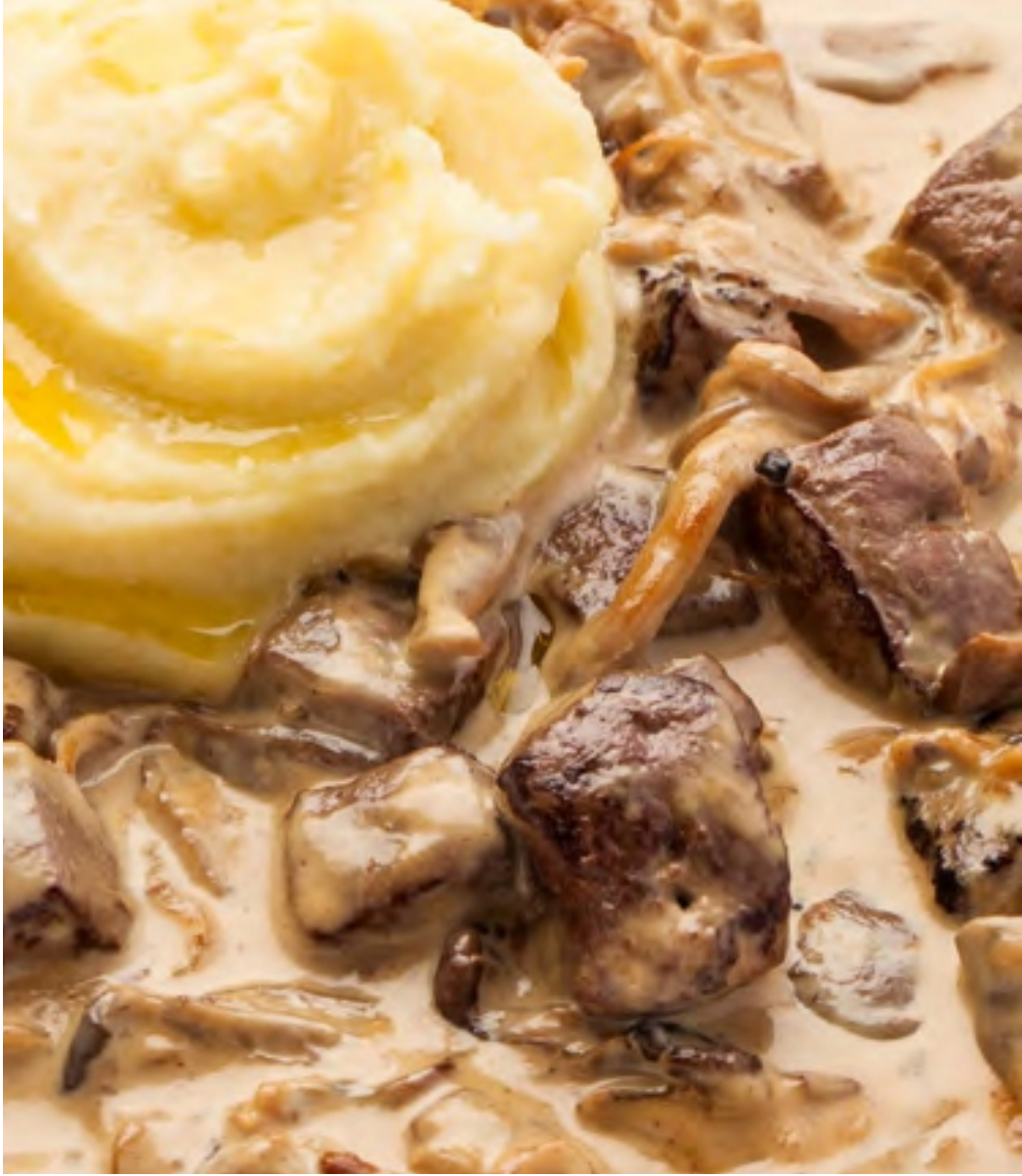
БЕФСТРОГАНОВ - 300гр - 750руб с картофельным пюре