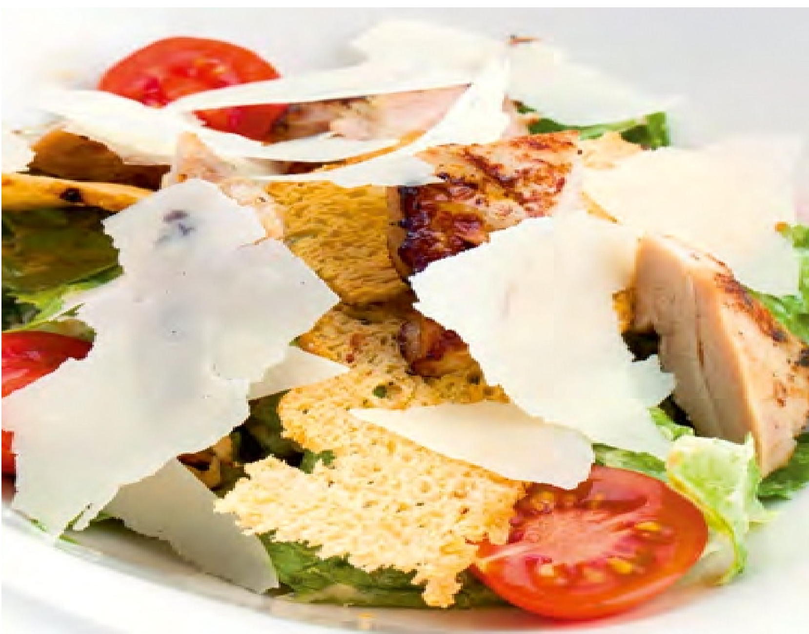
ЦЕЗАРЬ С ЦЫПЛЕНКОМ - 300гр - 480руб