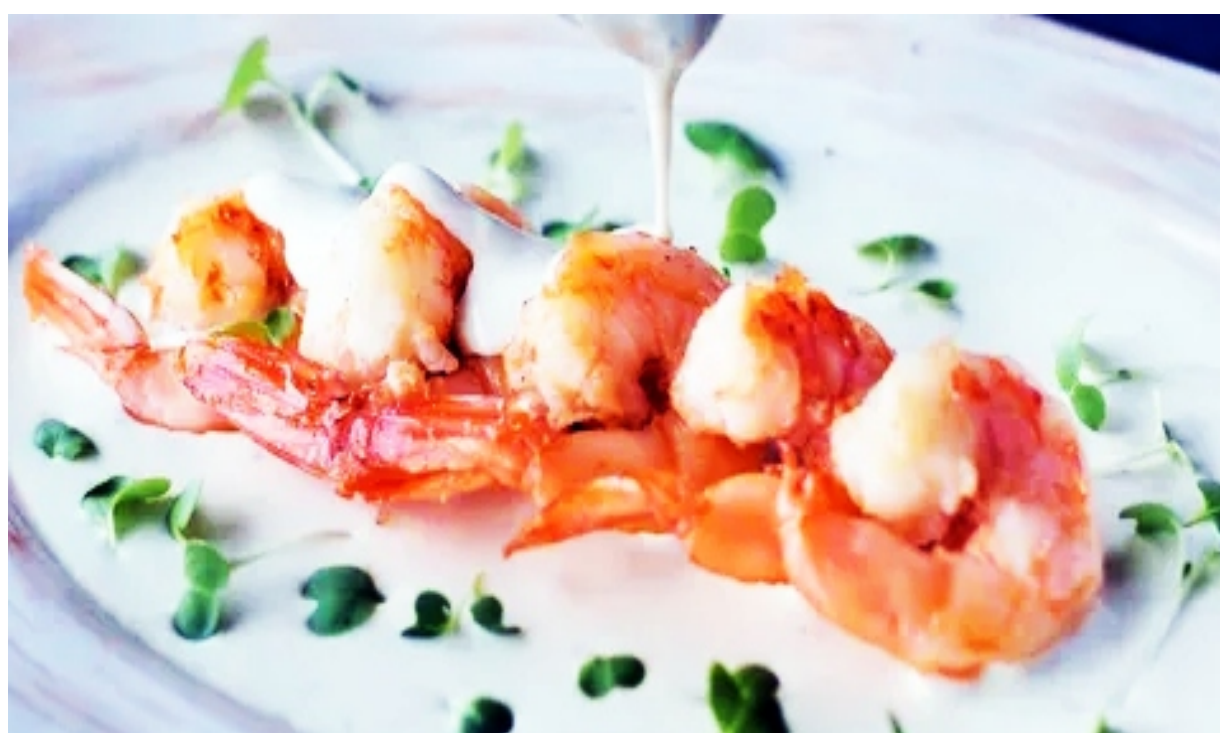
КРЕВЕТКИ С СОУСОМ ДОР-БЛЮ - 150/50гр - 920руб