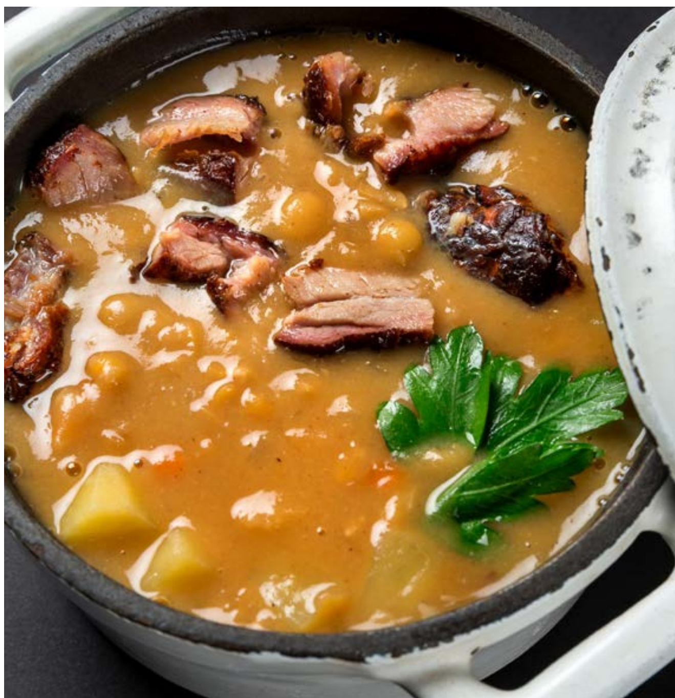
ГОРОХОВЫЙ С РЕБРАМИ ВВQ - 350гр - 280руб

ДОРОГИЕ ГОСТИ БЛЮДА НА ФОТОГРАФИЯХ В МЕНЮ МОГУТ ОТЛИЧАТЬСЯ ОТ ОРИГИНАЛА