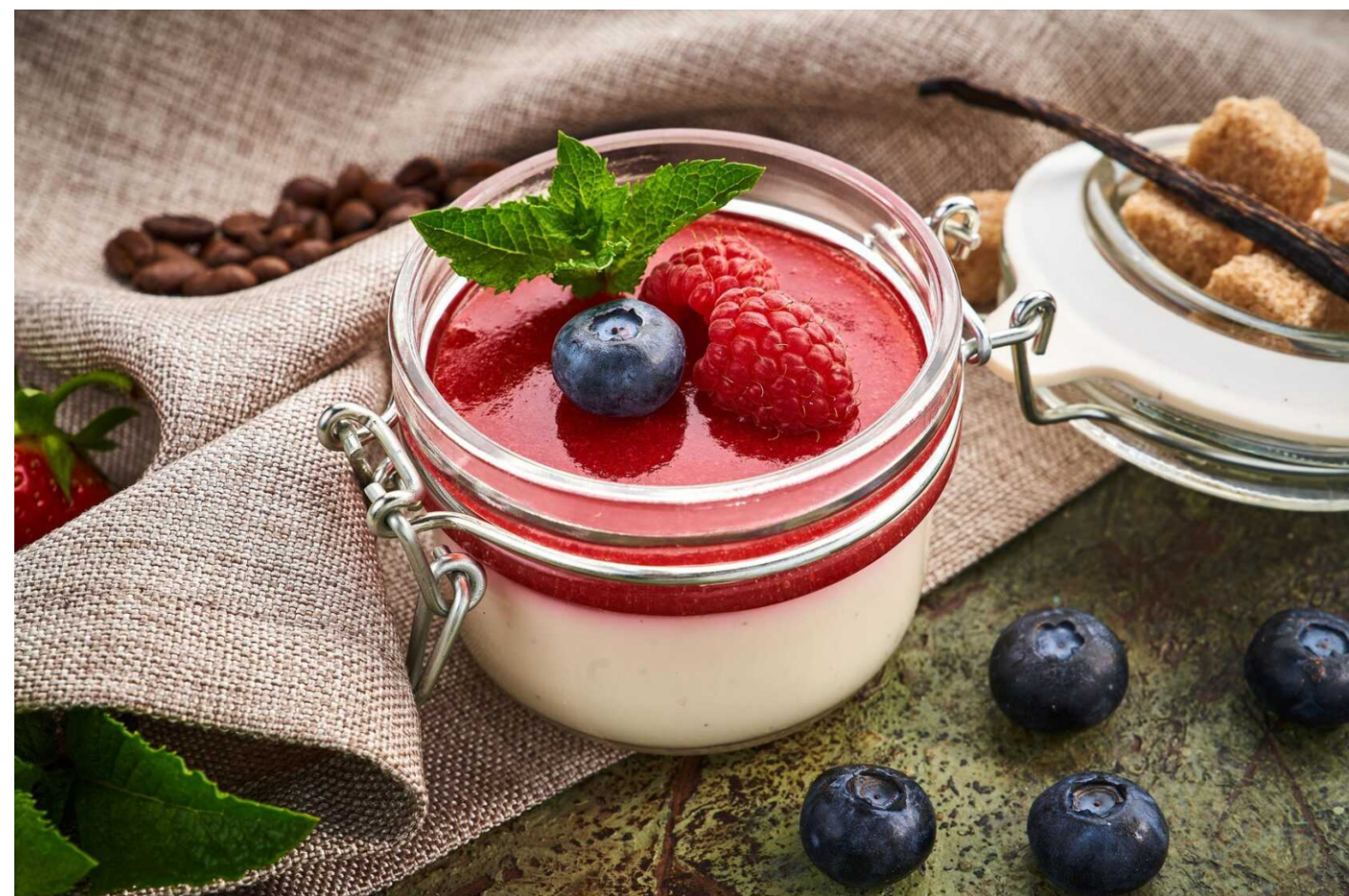
ПАННА-КОТА - 150гр - 250руб