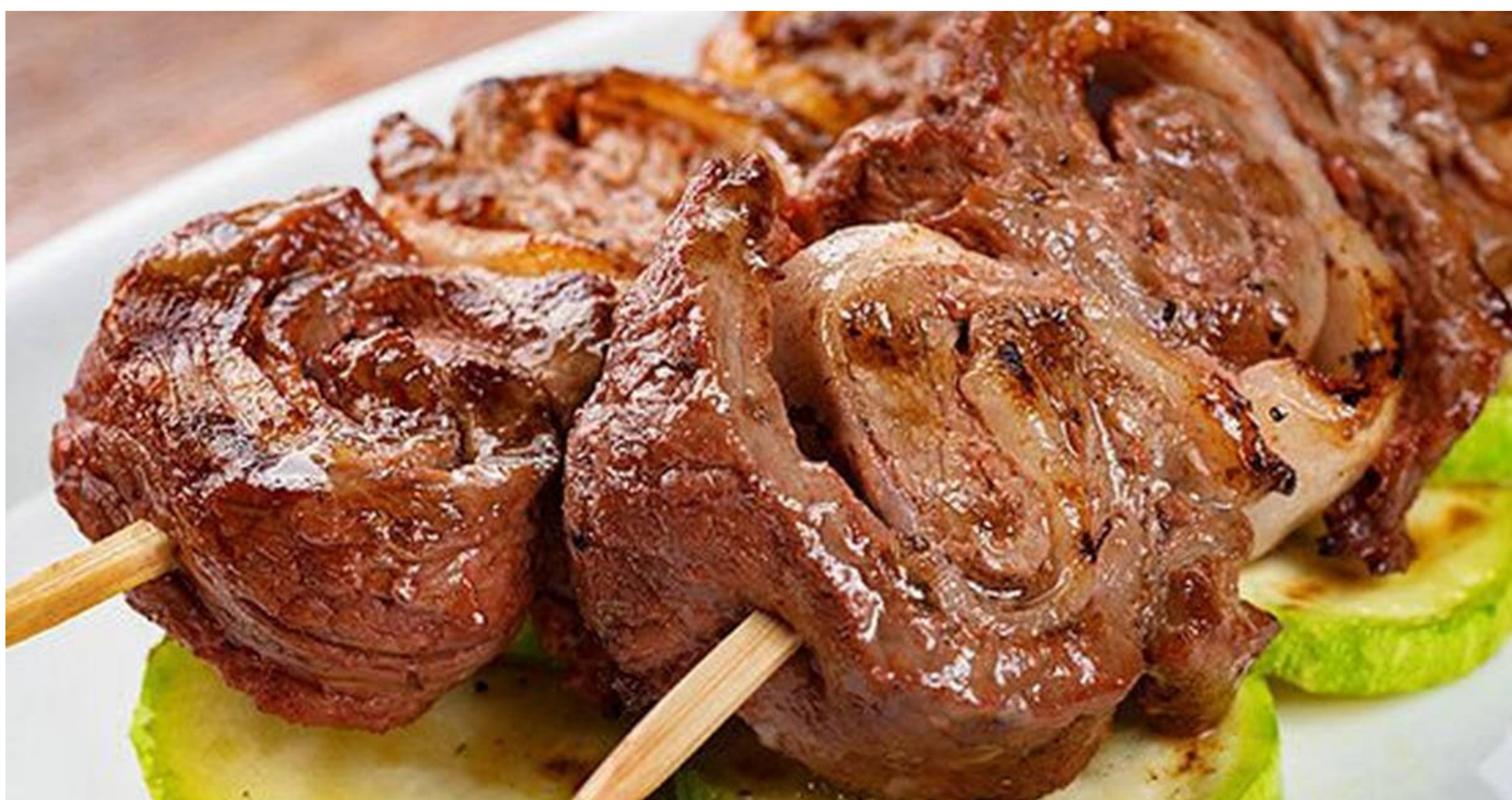
УРАМА - КЕБАБ ИЗ СВИНИНЫ / ГОВЯДИНЫ - 200/50/30 - 680руб. / 980 руб.