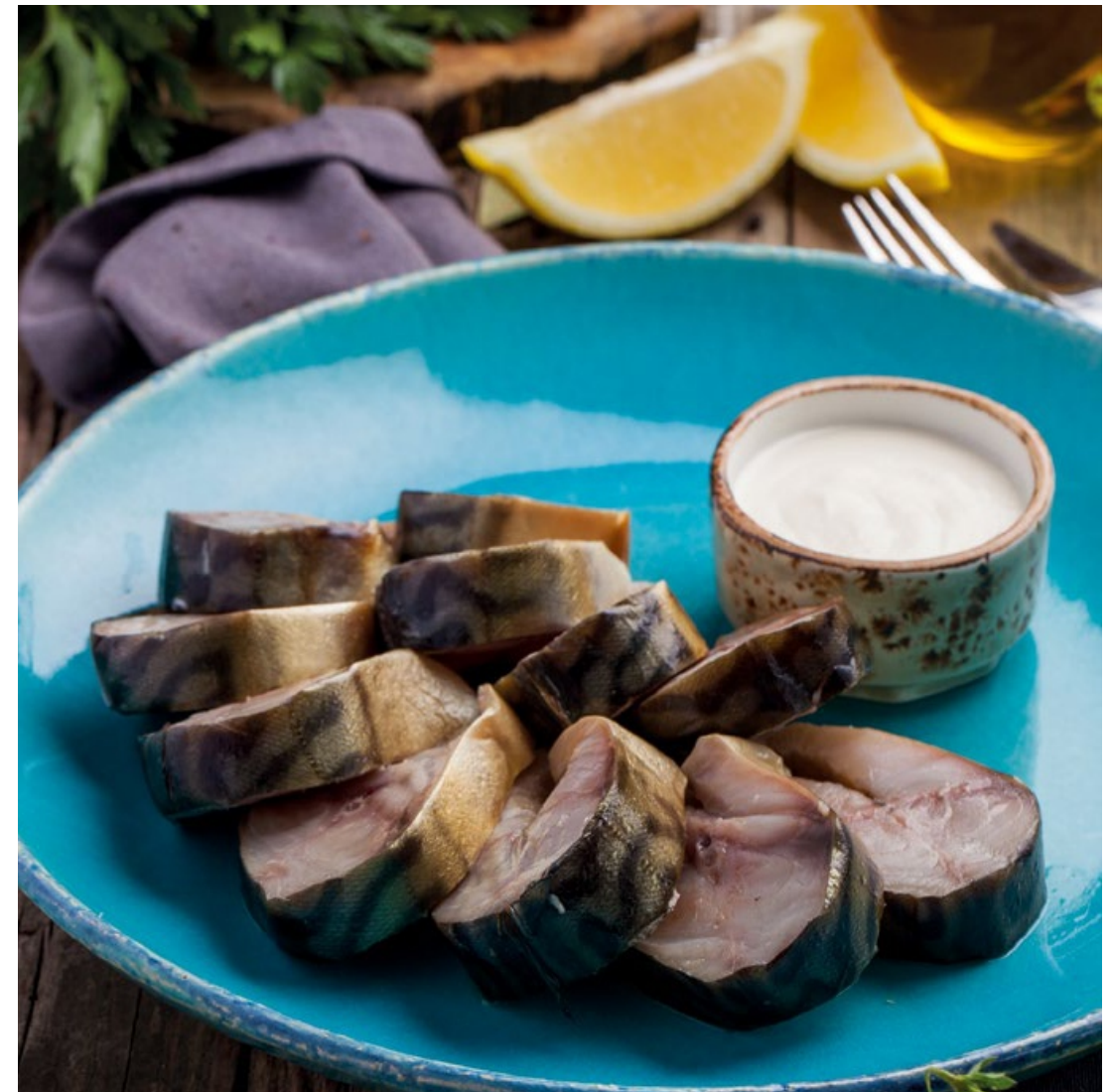
СКУМБРИЯ КОПЧЁНАЯ - 150гр - 300